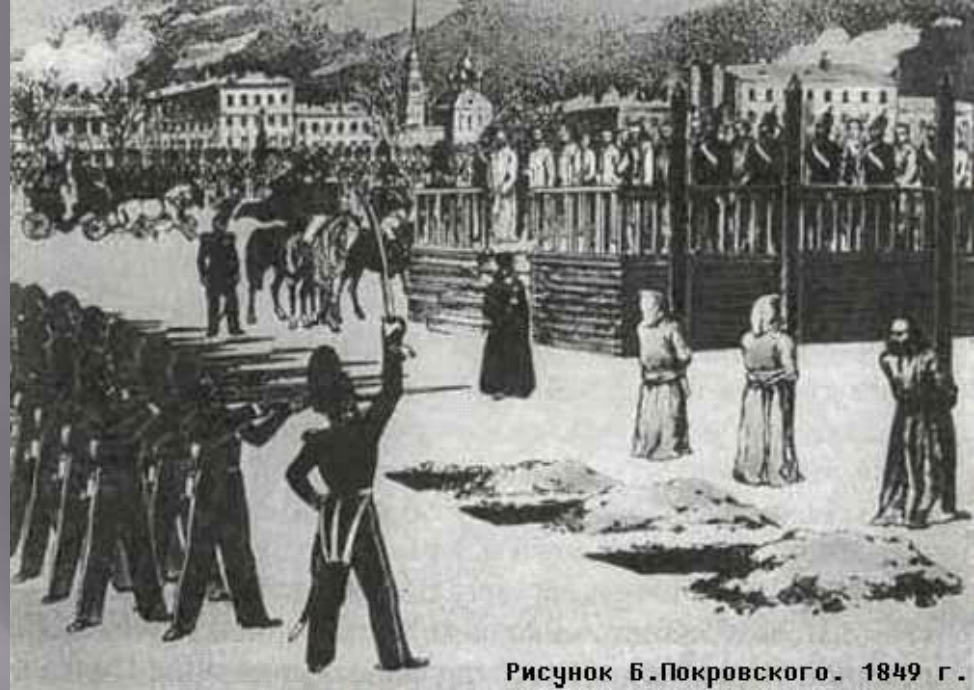
Рисунок Б.Покровского. 1849 г.

Через два дня Достоевского заковали в кандалы и отправили в Омский острог, в котором он содержался до февраля 1854 года.