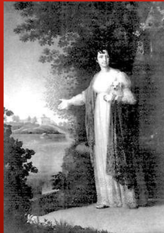
Дарья Алексеевна Дьякова (1767-1842), жена Г.Р.Державина