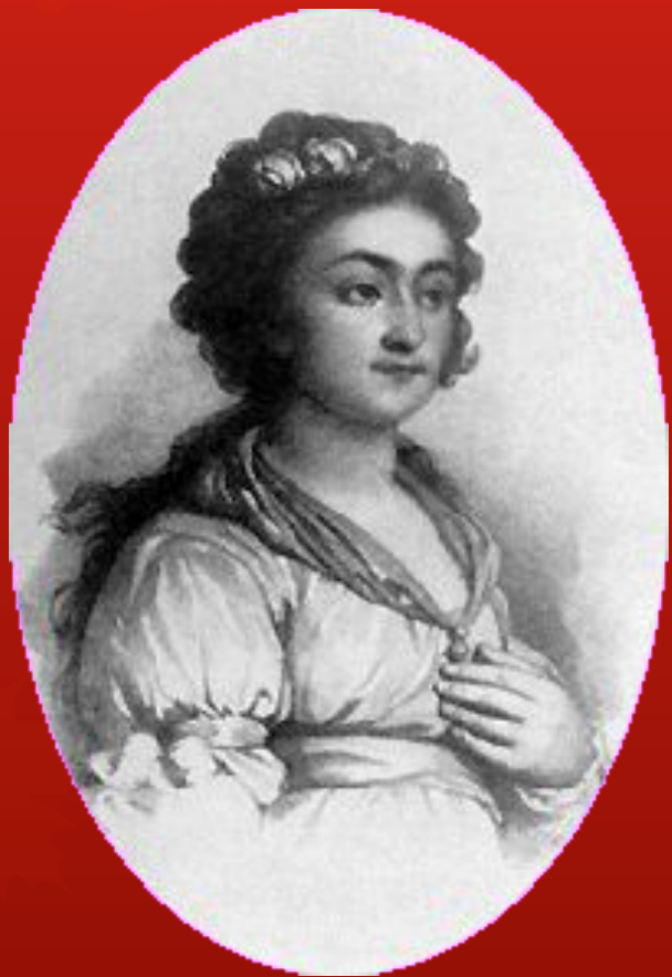
Первая жена Г.Р.Державина Екатерина Яковлевна Бастидон (1760-1794)

Найдя покровительство у князя Вяземского, Державин в 1777 году поступил на службу в Сенат. В следующем году он женился на Екатерине Яковлевне Бастидон. К этому времени денежные дела улучшились и помимо сенатского жалованья у Державина стало более тысячи душ крестьян. В 1780 году Гаврила Романович получил чин статского советника. Ода "Фелица", в которой восхвалялась Екатерина II, была напечатана в 1783 году. Стихотворение Державина растрогало императрицу до слез и в награду поэту была послана усыпанная бриллиантами золотая табакерка с пятьюстами червонцев