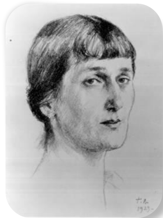
Верейский Г. С. Портрет А. А. Ахматовой. 1929