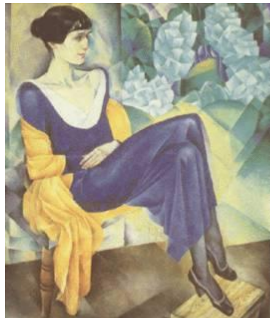
Альтман Н. И. Портрет А. А. Ахматовой. 1914