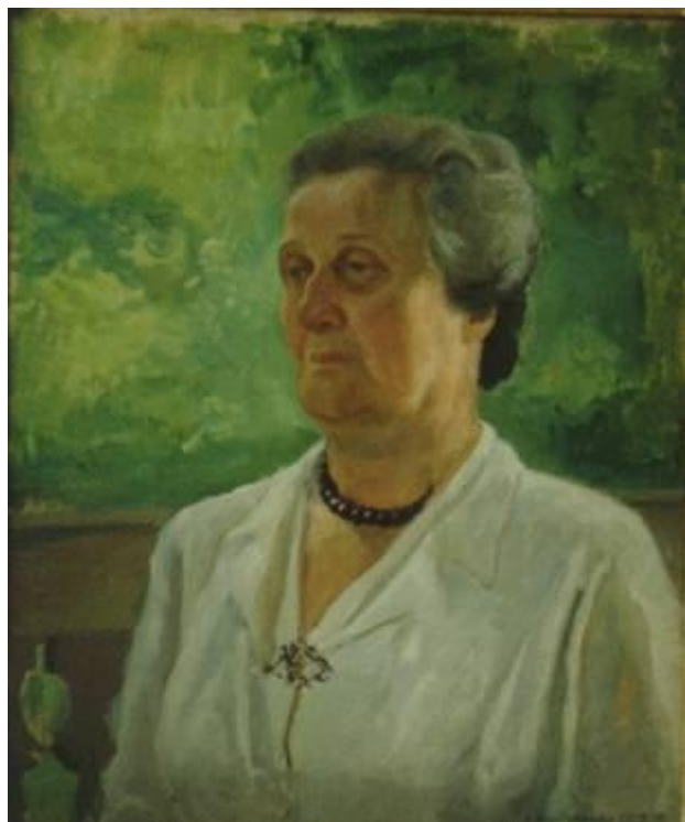
Шервинская А. С. Портрет А. А. Ахматовой. 1952