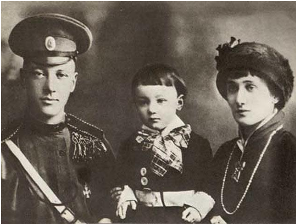
Николай Гумилёв, Анна Ахматова и их сын Лев

✓ посвящена жертвам сталинских репрессий