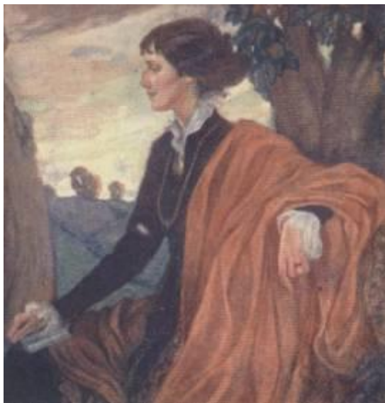
Делла-Вос-Кардовская О. Л. Портрет А. А. Ахматовой. 1914 Холст, масло.