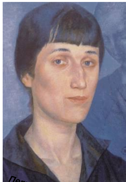
Петров-Водкин К. С. Портрет А. А. Ахматовой. 1922