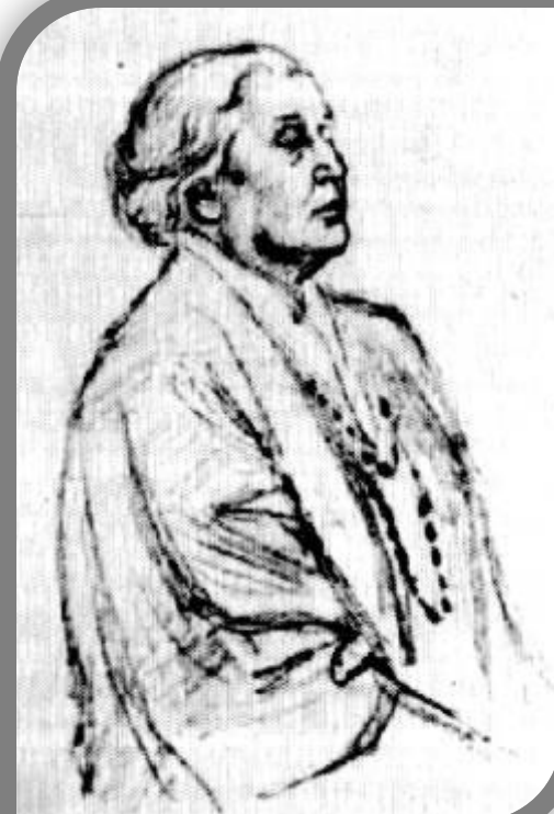
Фаворский В. А. Портрет А. А. Ахматовой. 1956