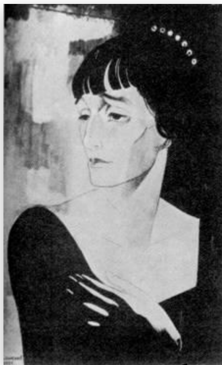
Анненков Ю. П. Портрет А. А. Ахматовой. 1921 Бумага, гуашь