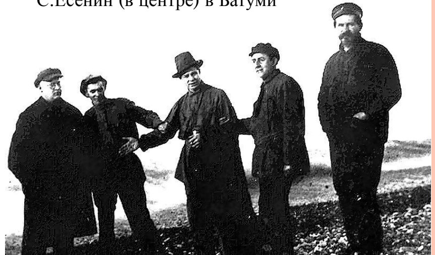
С.Есенин (в центре) в Батуми