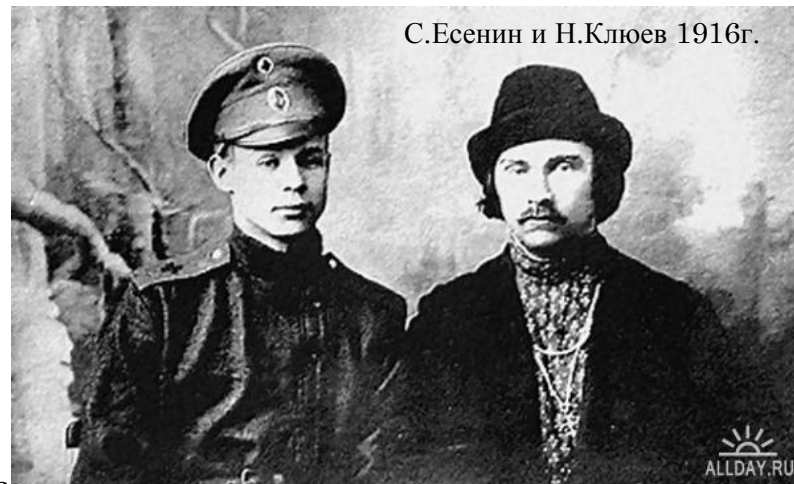
С.Есенин и Н.Клюев 1916г.

Своеобразным итогом первой половины творчества поэта является статья «Ключи Марии», написанная в 1918 году, в которой отражено познание им природы художественного образа, осмысливается через народное поэтическое слово исторический опыт русского народа.