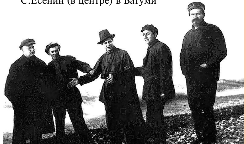
С.Есенин (в центре) в Батуми