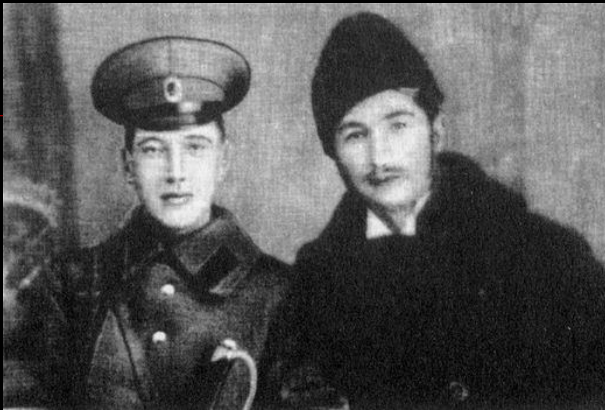
Николай Гумилев и Сергей Городецкий. 1915 г.