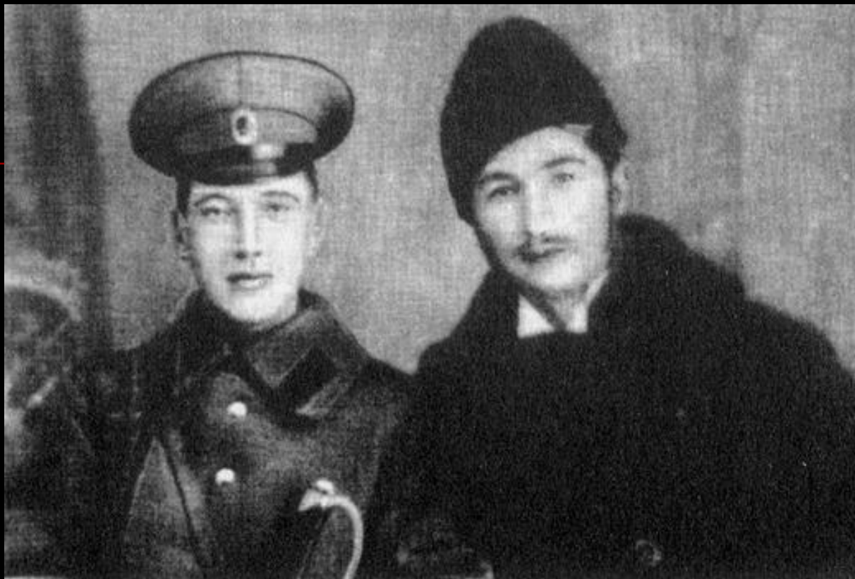
Николай Гумилев и Сергей Городецкий. 1915 г.