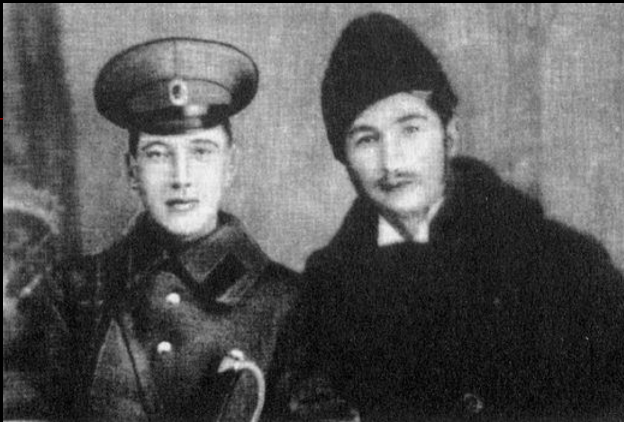
Николай Гумилев и Сергей Городецкий. 1915 г.