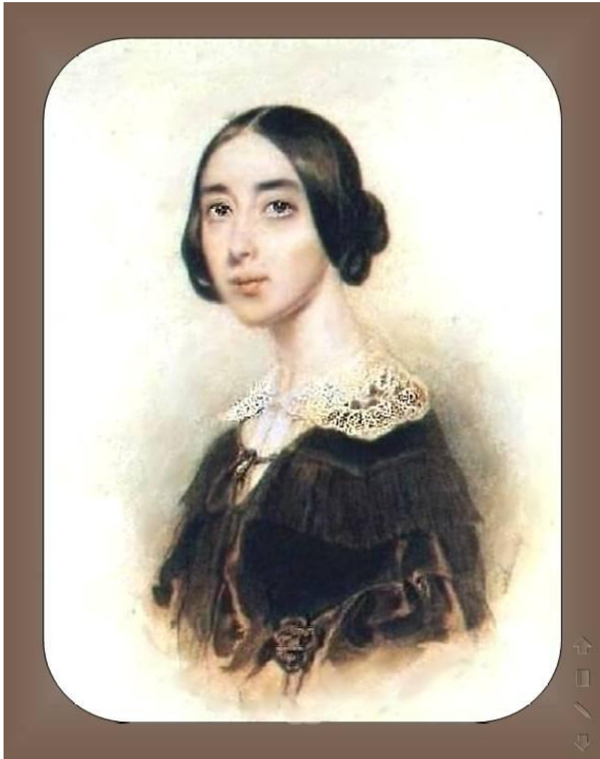
Полина Виардо (Виардо-Гарсия)