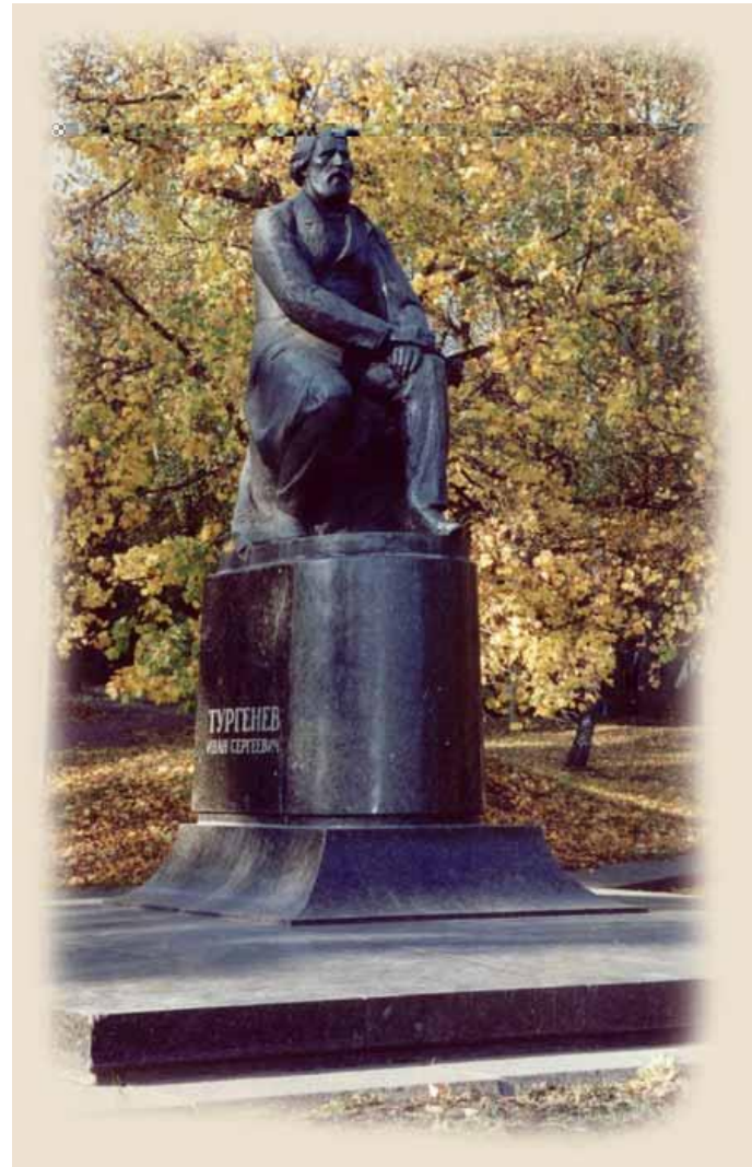
Памятник Тургеневу И.С.