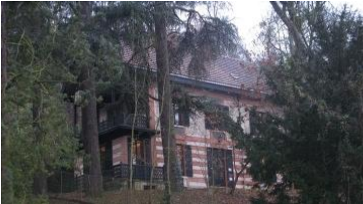
Дом Тургенева в усадьбе «Ясени» в Буживале

К концу жизни слава Тургенева достигла своего апогея как в России, где он опять становится всеобщим любимцем, так и в Европе, где критика, в лице самых выдающихся своих представителей - Тэна, Ренана, Брандеса и др. - причислила его к первым писателям века.