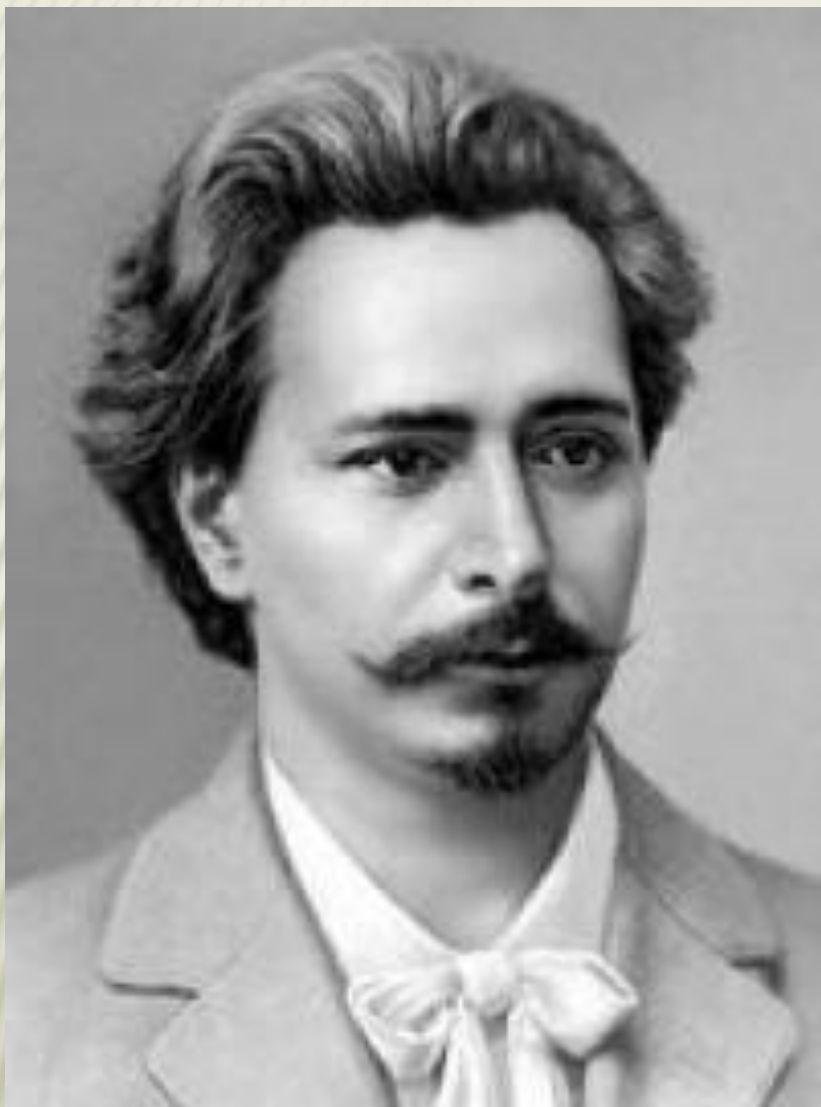
ЛЕОНИД НИКОЛАЕВИЧ АНДРЕЕВ (1871 – 1919)