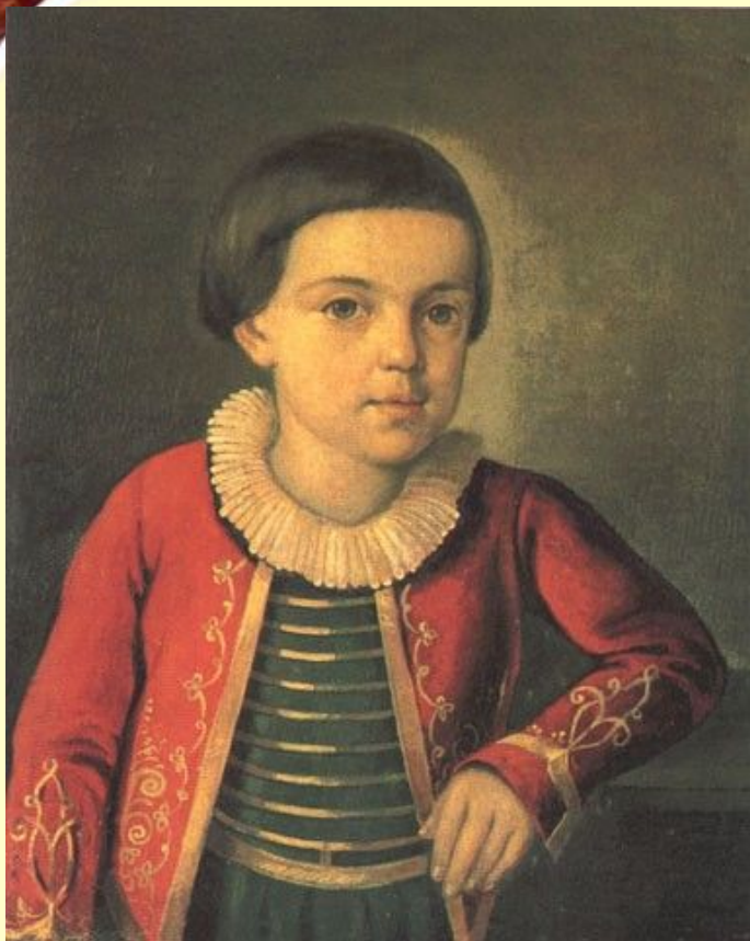
Самый ранний из известных портретов Лермонтова (1820-1822 год)