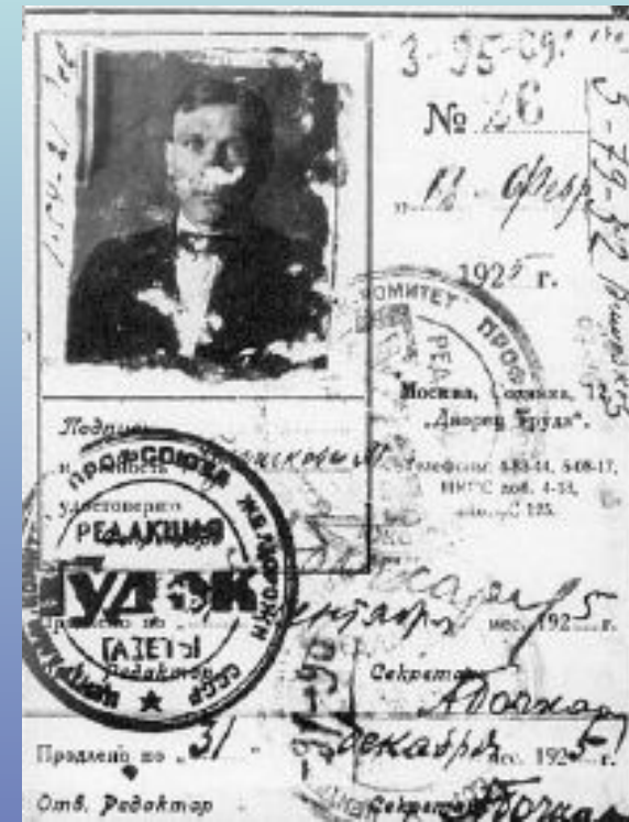
Удостоверение выдано М.А. Булгакову в редакции газеты "Гудок"