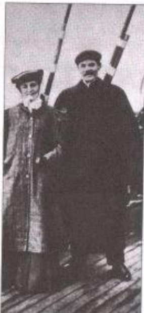
М. Горький и М. Андреева на пути в Америку. 1906

Статья «Буря энтузиазма...» о приезде Горького в США в газете «Нью-Йорк Таймс»