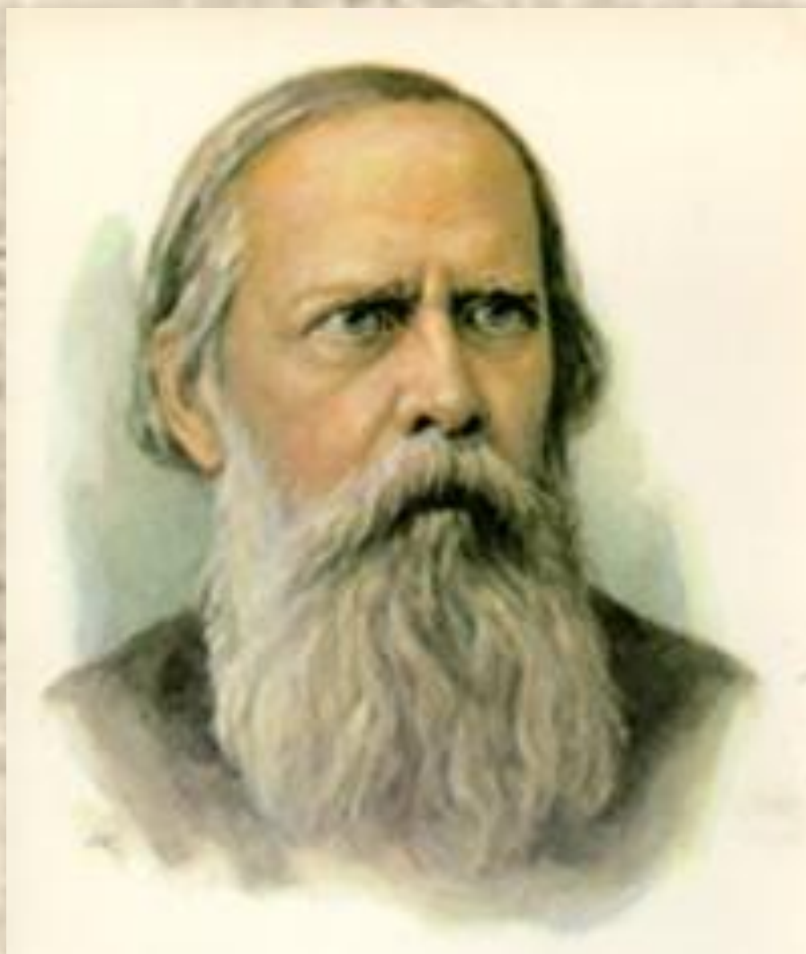
Салтыков-Щедрин (псевдоним - Н. Щедрин) Михаил Евграфович (1826 - 1889), прозаик.