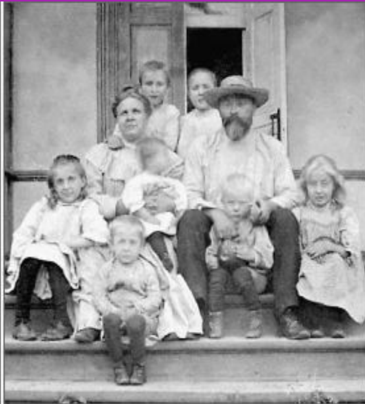
Семья Булгаковых на даче (1903)

В загородном доме– даче, в поселке Буча под Киевом, семья регулярно проводила летние месяцы