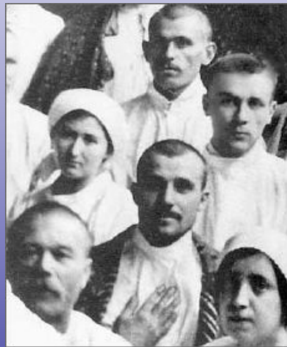
М.Булгаков среди мед.персонала военного госпиталя Саратов 1914г.