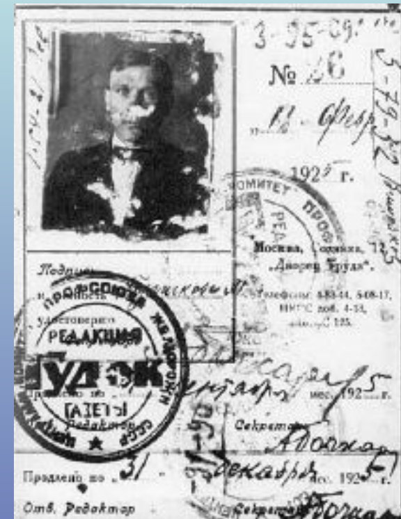
Удостоверение выданное М.А. Булгакову в редакции газеты "Гудок"