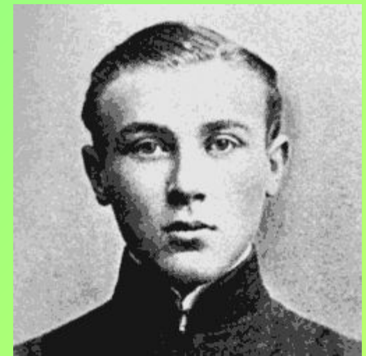
М.Булгаков студент 1 курса медицинского факультета Киевского Императорского университета св.Владимира