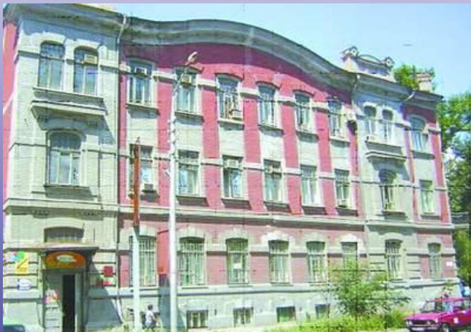
Здание сохранилось и в наше время (находится на пересечении улиц Вольской и Сакко и Ванцетти)

Еще летом 1914 года, после начала 19 июля Первой мировой войны, Булгаков принял участие в организации лазарета для раненых при Казенной палате в Саратове и работал там врачом.