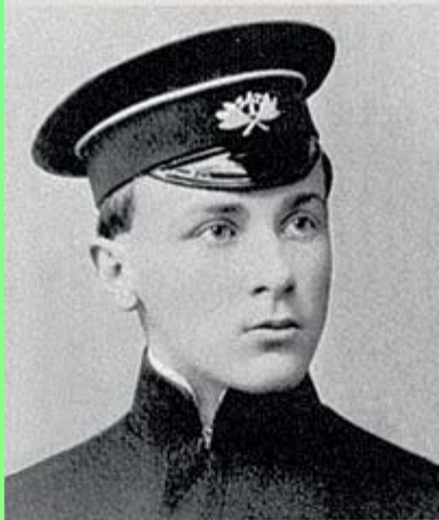
гимназист выпускного класса Киевской Первой гимназии Киев 1908г.

• До осени 1900 учился дома, затем поступил в первый класс Александровской гимназии, где были сосредоточены лучшие преподаватели Киева. Уже в гимназии Булгаков проявлял свои разнообразные способности: писал стихи, рисовал карикатуры, играл на рояле, пел, сочинял устные рассказы и прекрасно их рассказывал.