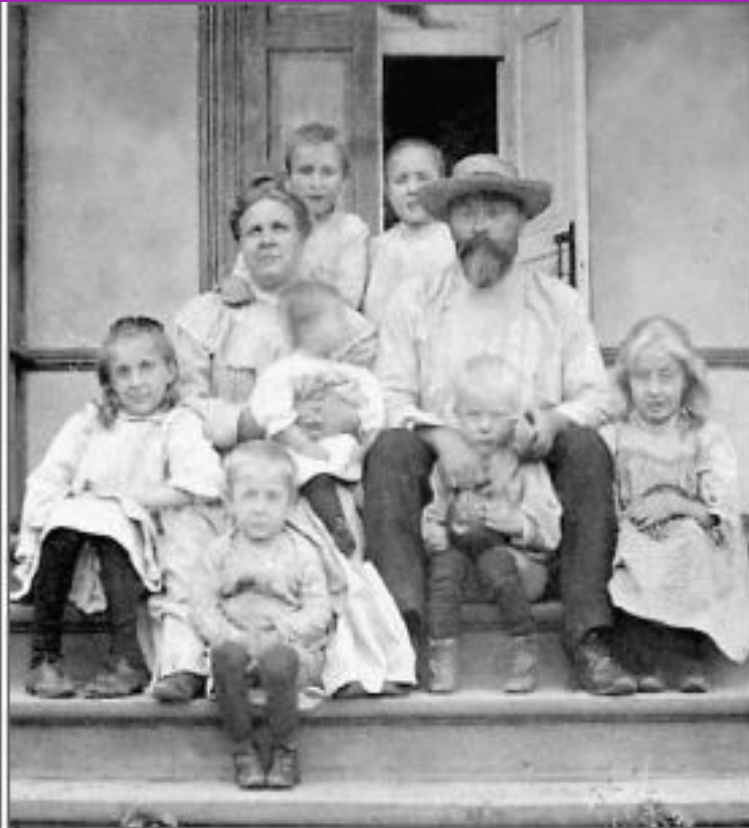
Семья Булгаковых на даче (1903)

В загородном доме– даче, в поселке Буча под Киевом, семья регулярно проводила летние месяцы