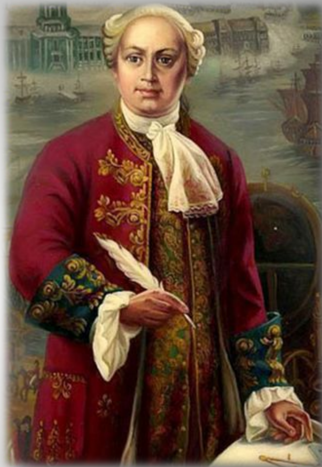
Неизвестный художник XVIII век «М.В.Ломоносов»