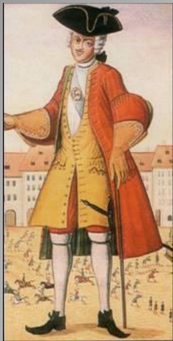
Студент немецкого университета