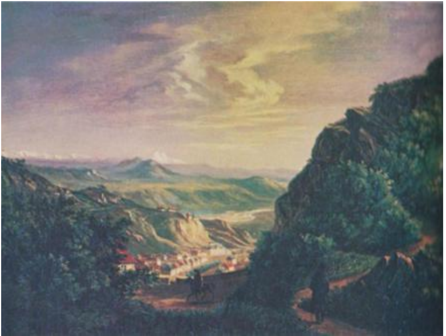
Вид Пятигорска. Картина Лермонтова 1837-38