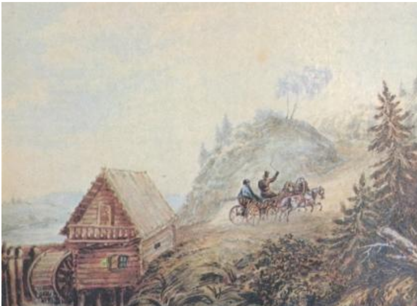
Пейзаж с мельницей и скачущей тройкой. Акварель. 1835-36