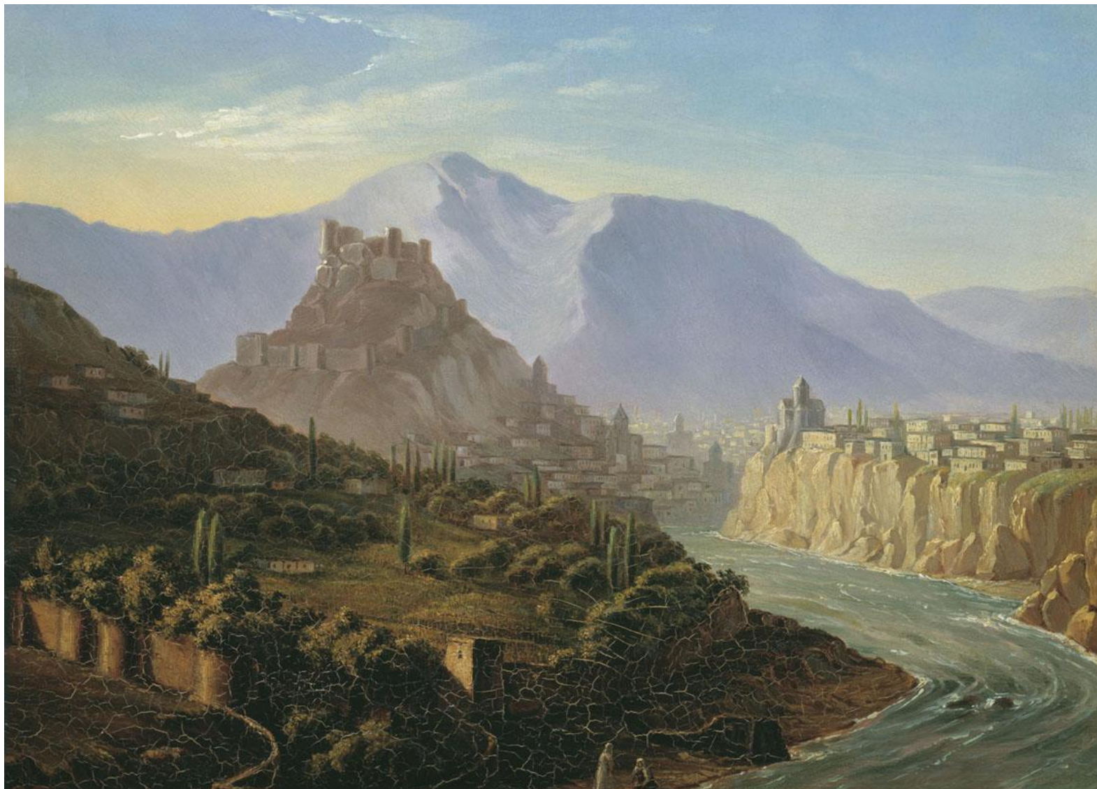
Картина Лермонтова Вид Тифлиса.