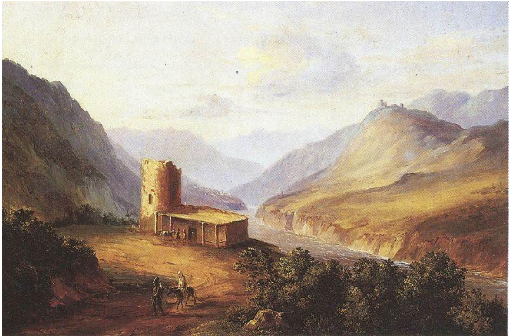
Военно-Грузинская дорога близ Мцхеты (Кавказский вид с саклей). 1837. Картина М. Ю. Лермонтова. Картон, масло.