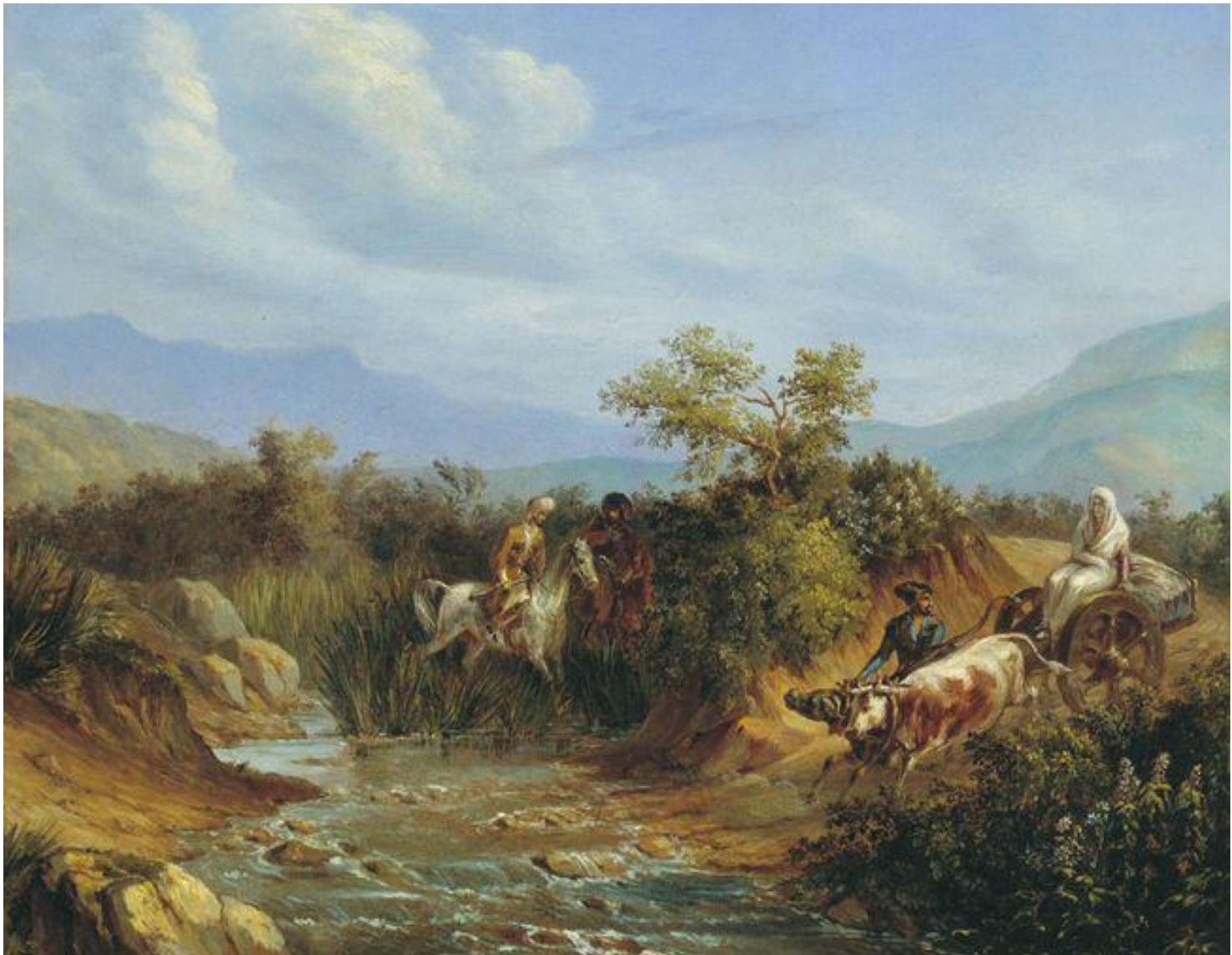
Нападение. Сцена из кавказской жизни.