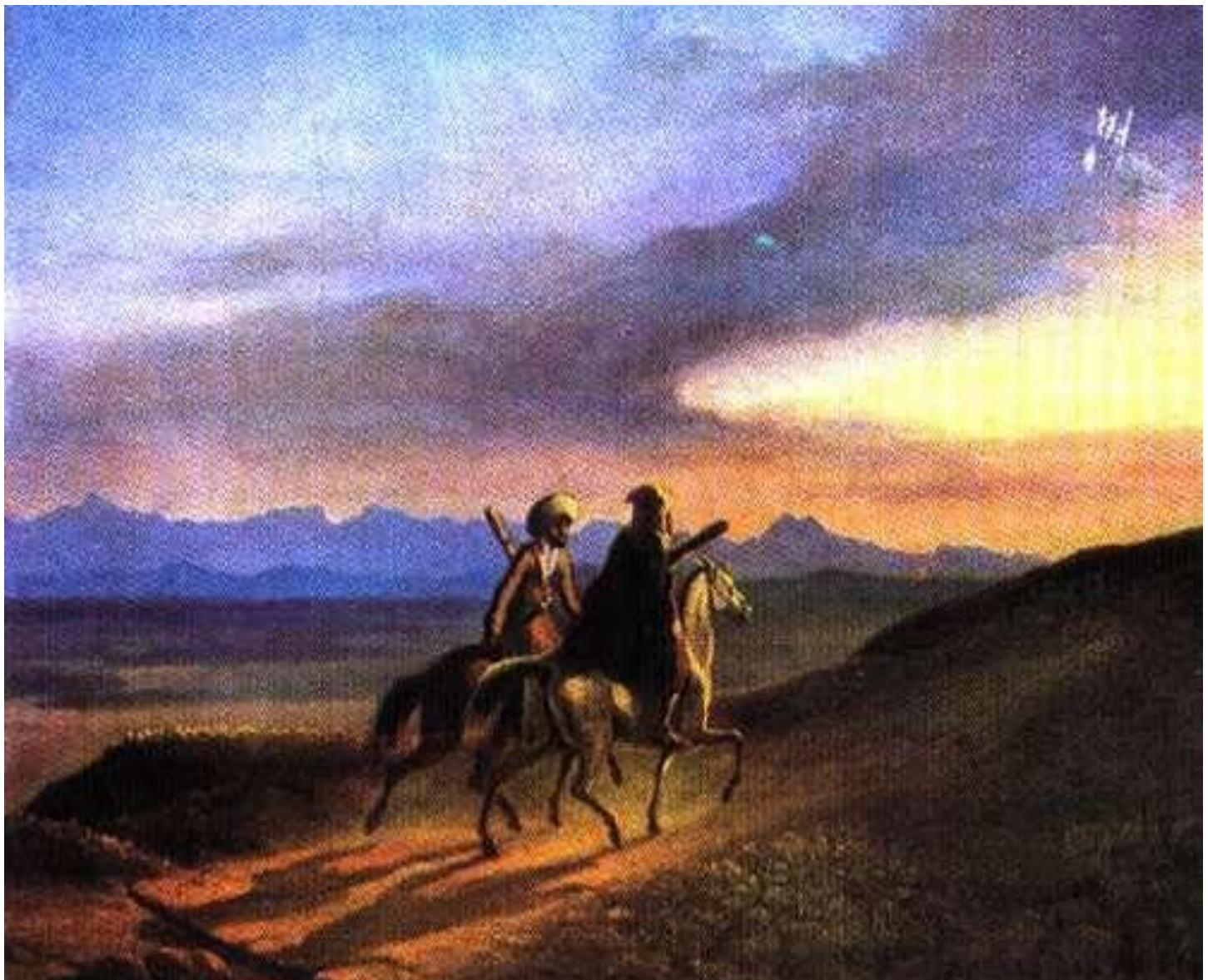
Воспоминание о Кавказе