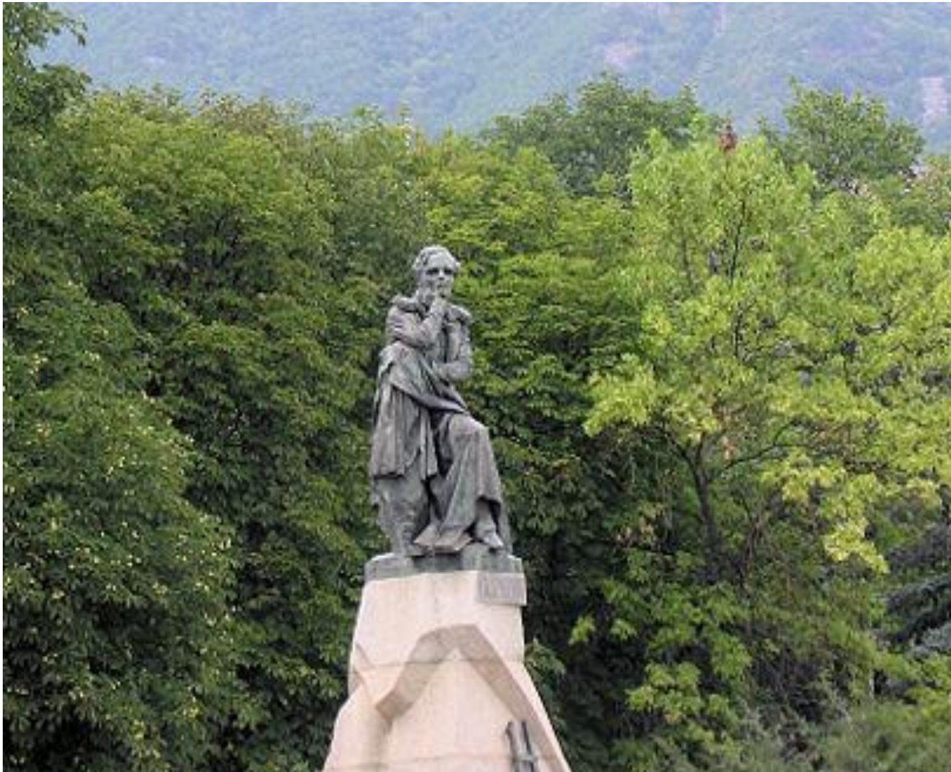
Памятник Лермонтову в Пятигорске