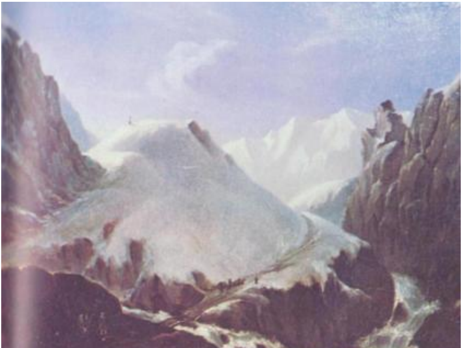
Крестовый перевал. Масло. 1837-38