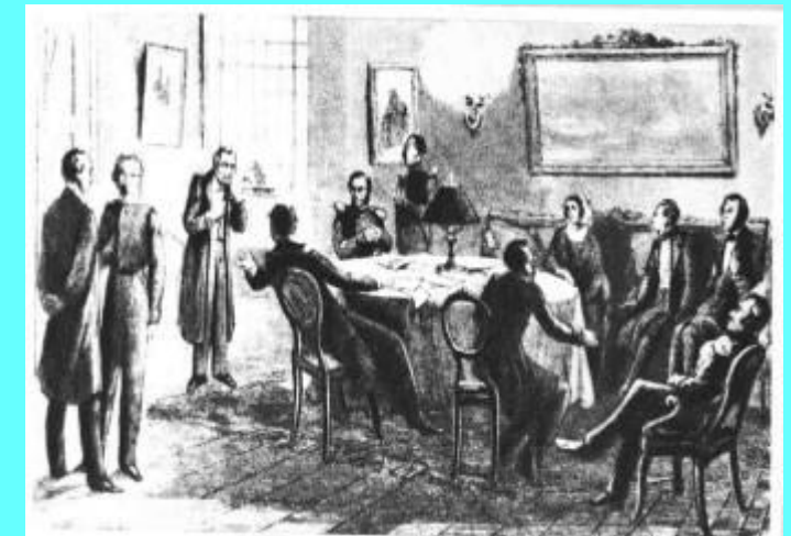
Редакция журнала «Современник»