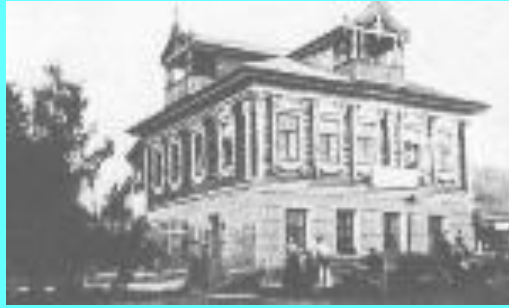
Дом-усадьба в Грешнёво