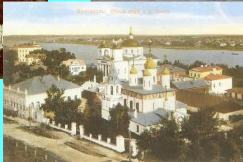
Ярославль. Общий вид и река Волга.