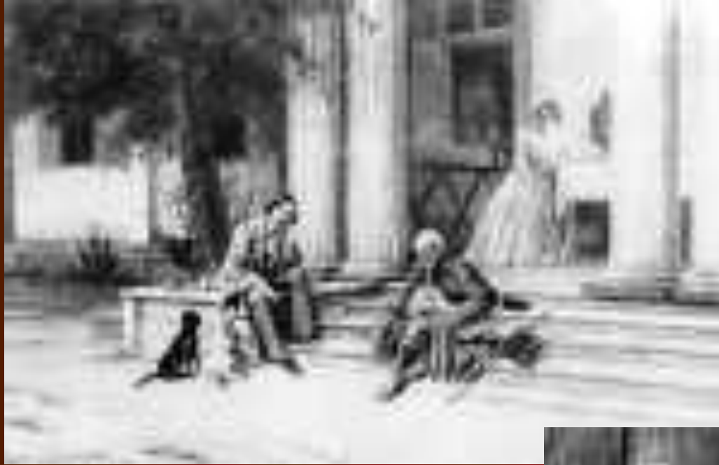
Н.В. Гоголь в Яновщине