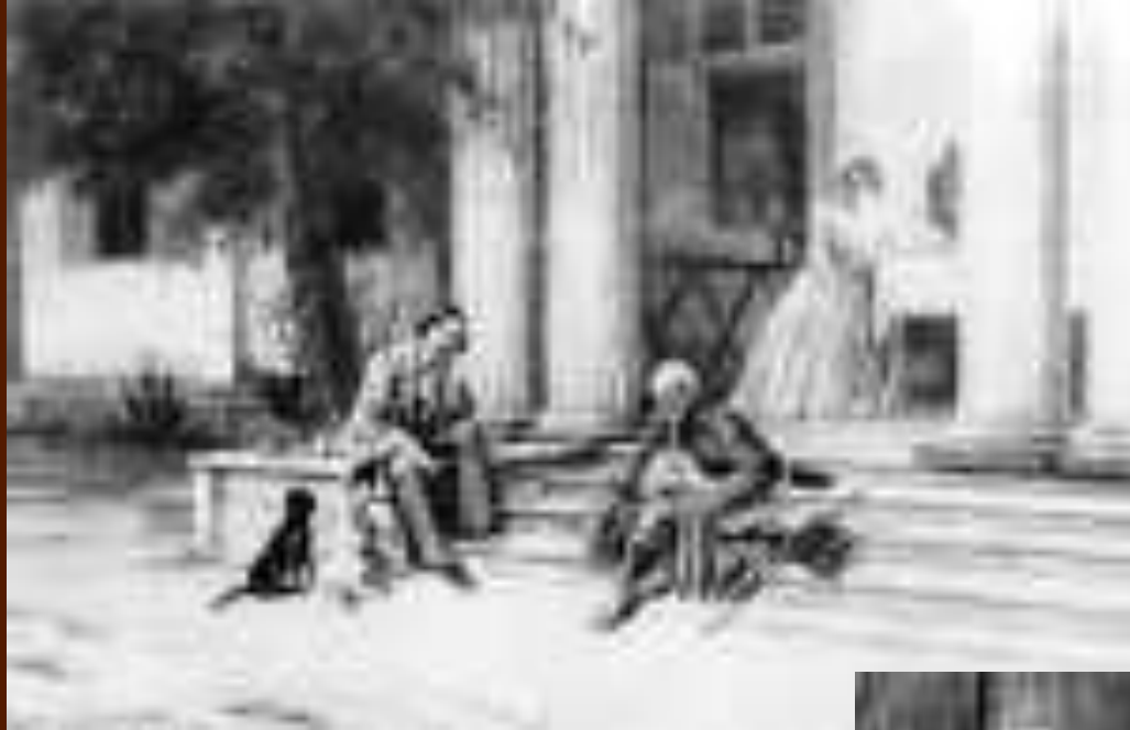
Н.В. Гоголь в Яновщине