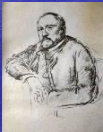
Портрет Н. С. Лескова работы И. Е. Репина