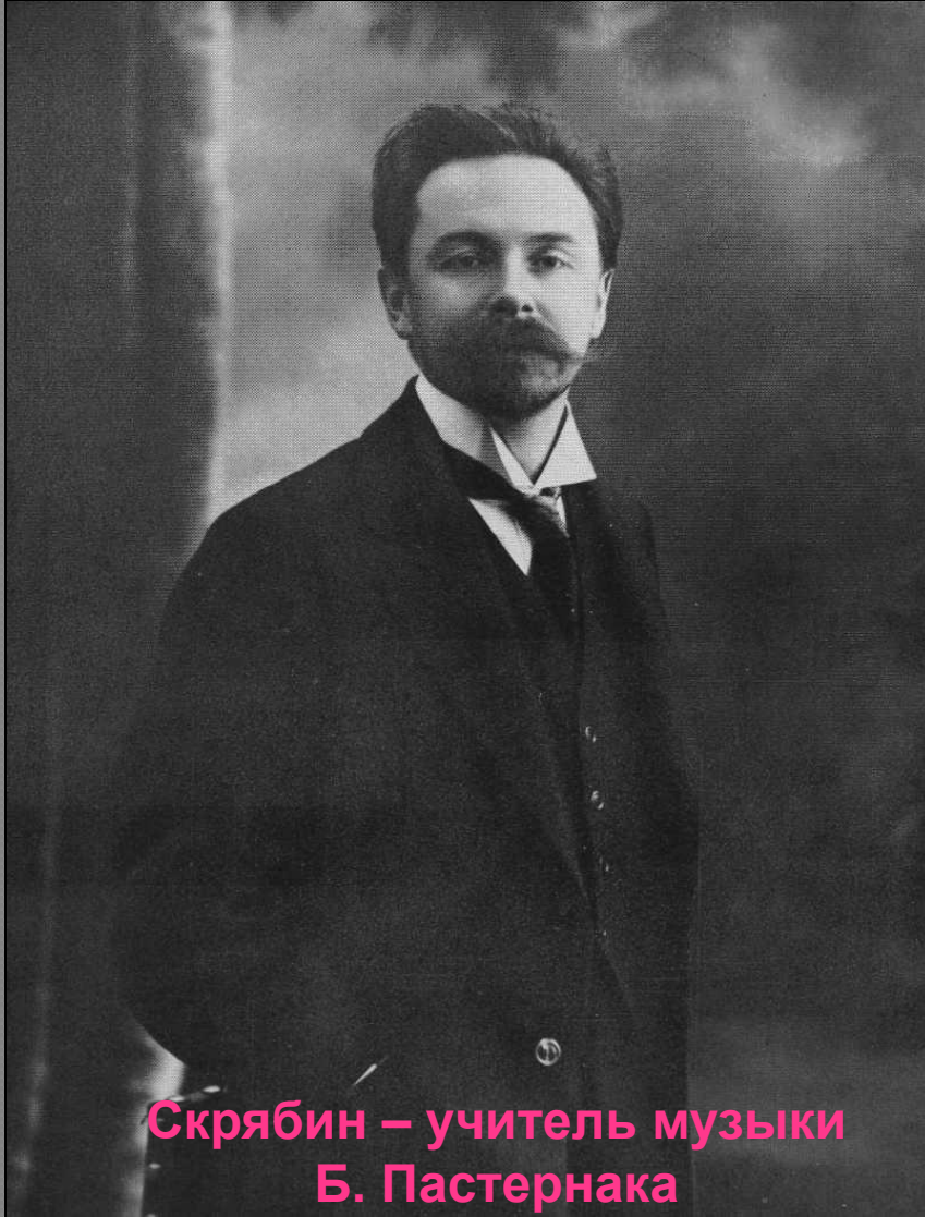
Скрябин – учитель музыки Б. Пастернака