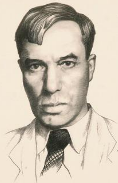
Борис Леонидович Пастернак 1890—1960