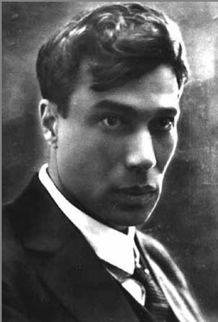
Борис Леонидович Пастернак (1890-1960)