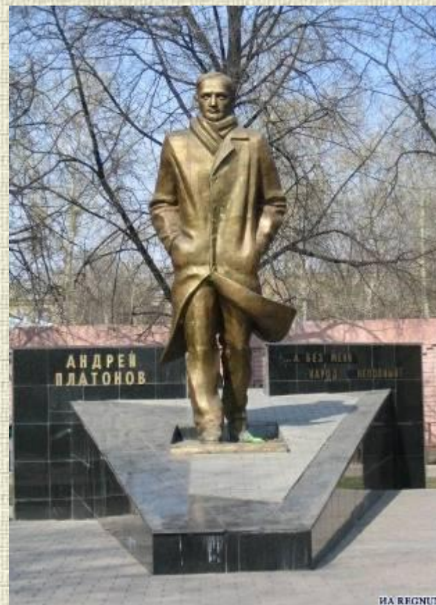
Памятник на родине писателя в городе Воронеже