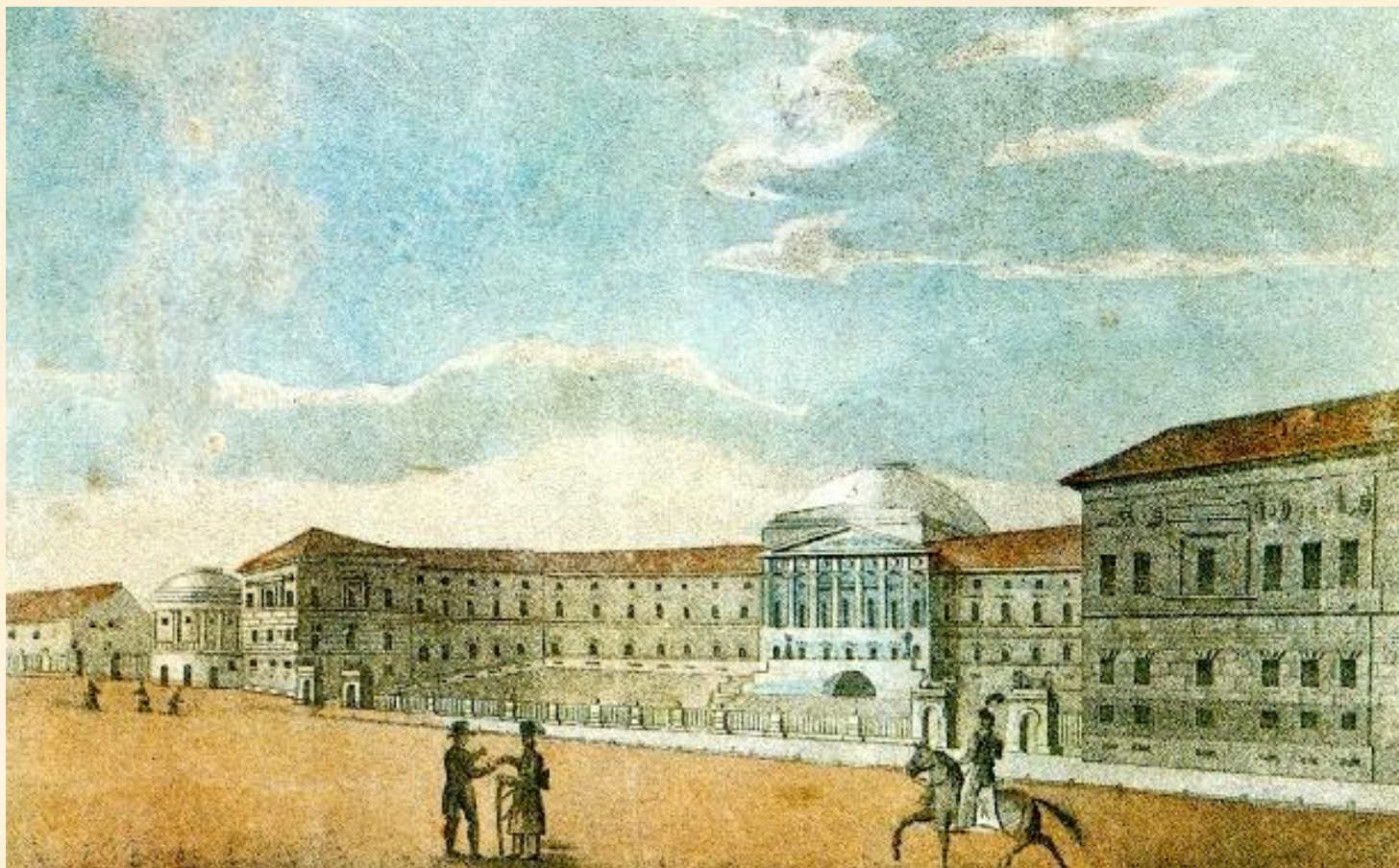
Московский университет. Работа неизвестного художника, 1820-е гг.