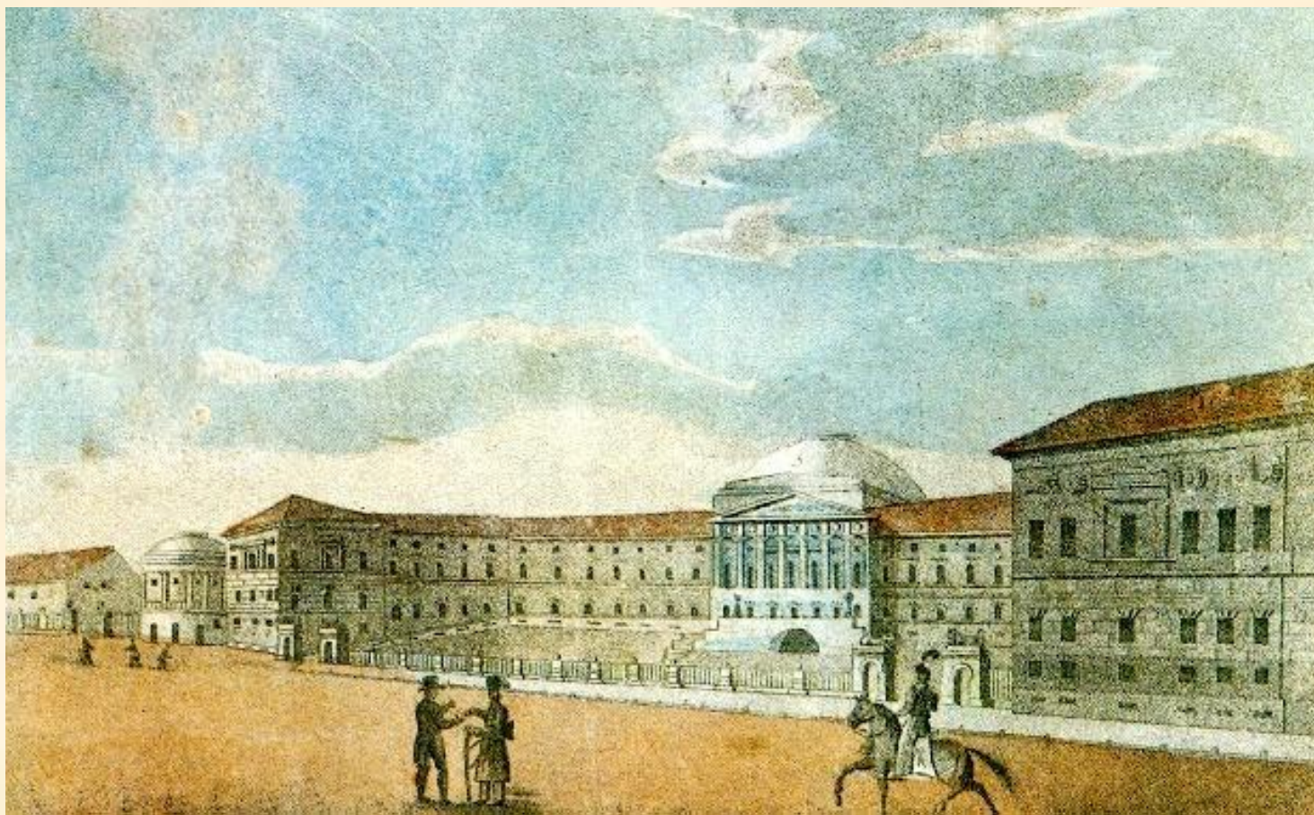
Московский университет. Работа неизвестного художника, 1820-е гг.

1819-1821гг Тютчев учится в Московском университете. Слушает лекции профессора А.Ф.Мерзлякова по теории словесности и истории русской литературы.