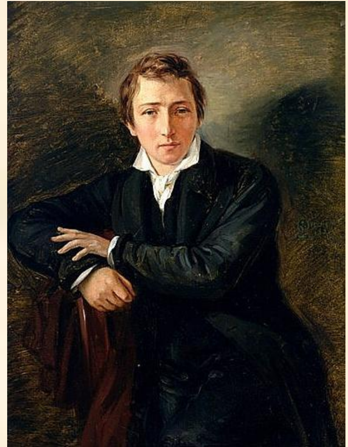
Иоганн Вольфганг фон Гёте