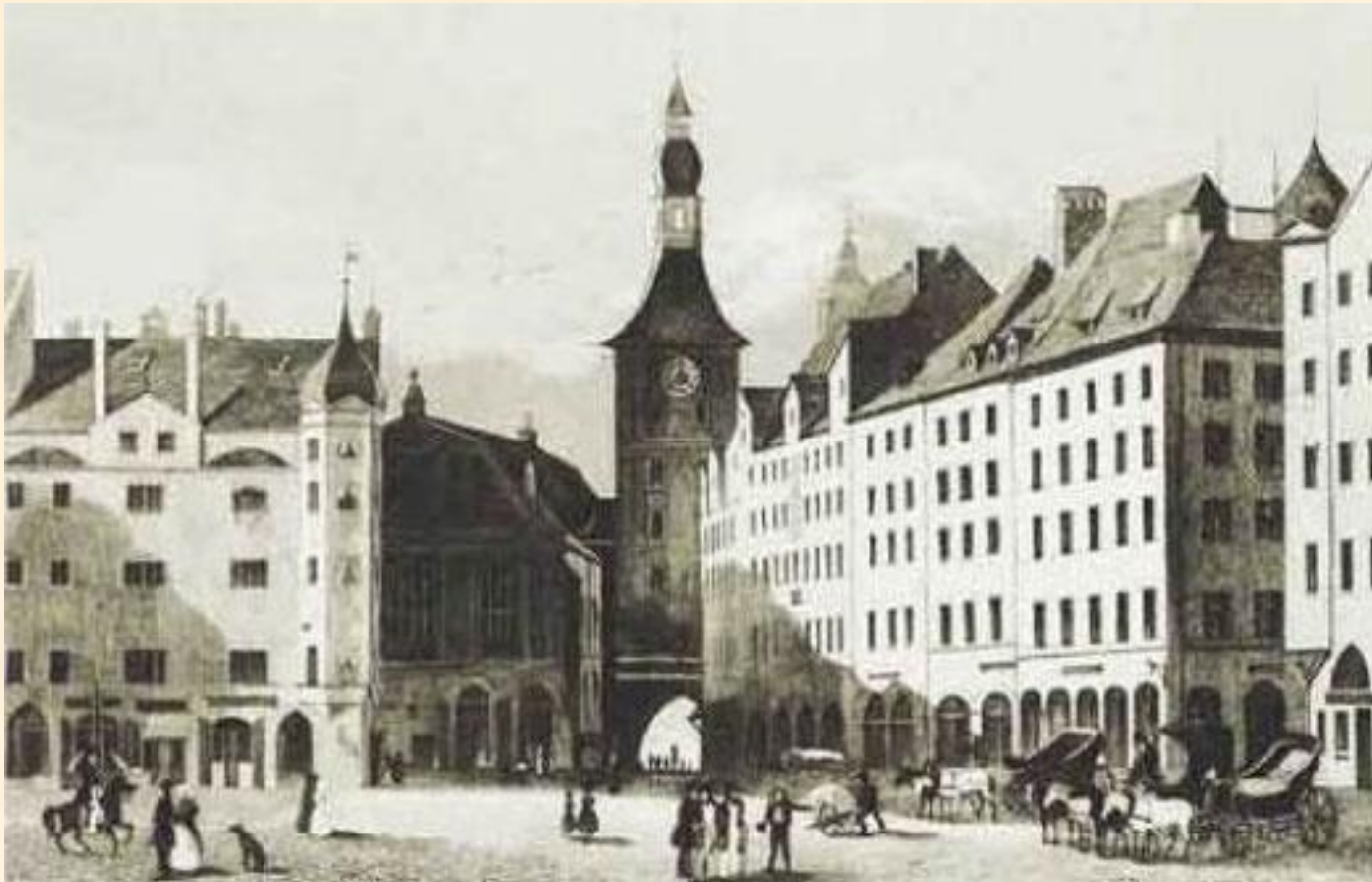
Городская ратуша в Мюнхене. Гравюра К. Герстнера по рис. Й. Хоффмейстера. Мюнхен. 1840 г.

В июне 1822 года, получив место сверхштатного чиновника русской миссии в Баварии, Тютчев отправляется в Мюнхен.