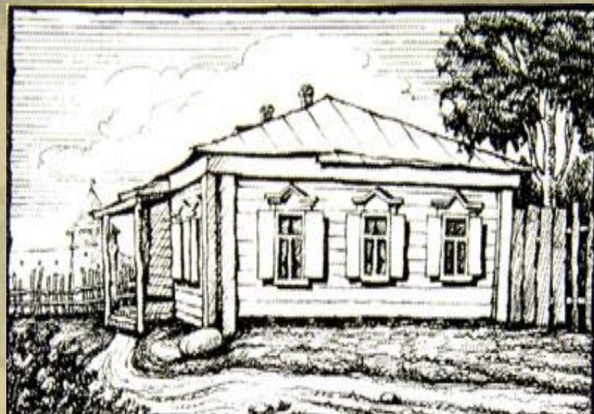
Дом в Зарайске, где родился В.В. Виноградов.