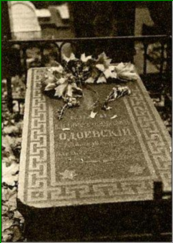
Могила В.Ф. Одоевского в Донском монастыре

Умер Одоевский в Москве 27 февраля 1869, не оставив после себя ни детей, ни какого-либо состояния. Похоронен на Донском кладбище в Москве.