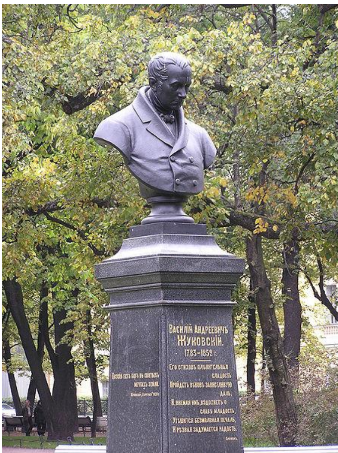
Памятник Жуковскому в Александровском саду в Санкт-Петербурге