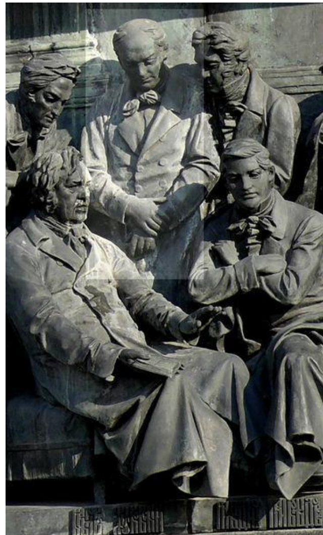
В. А. Жуковский на Памятнике «1000-летие России» в Великом Новгороде