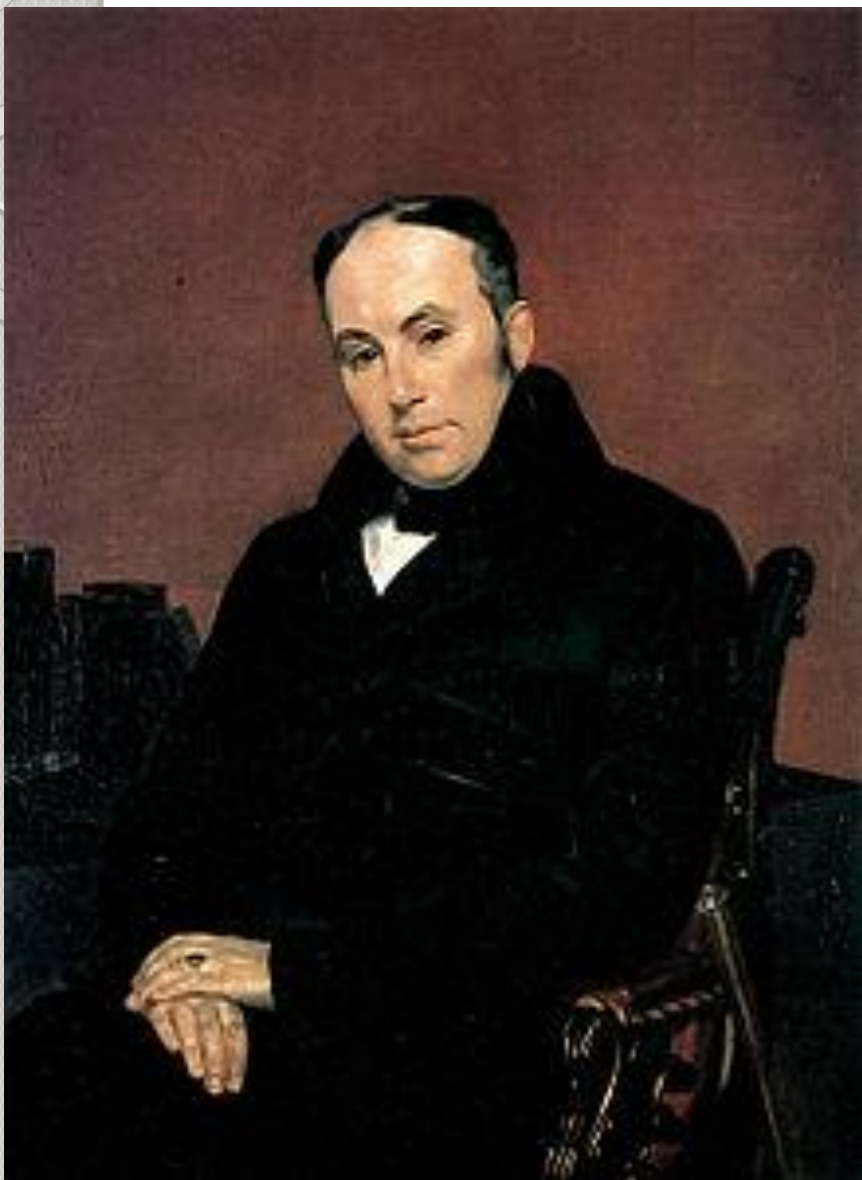
Василий Андреевич Жуковский 1783-1852