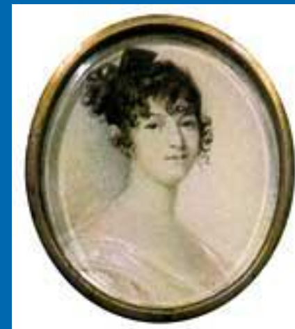
Мать, Надежда Осиповна Пушкина (1775-1836г.)