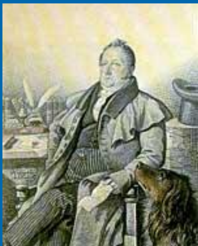
□ Отец, Сергей Львович Пушкин (1770-1838г. )