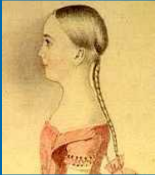
□ Старшая дочь, Мария Александровна Пушкина (1832-1919г.)