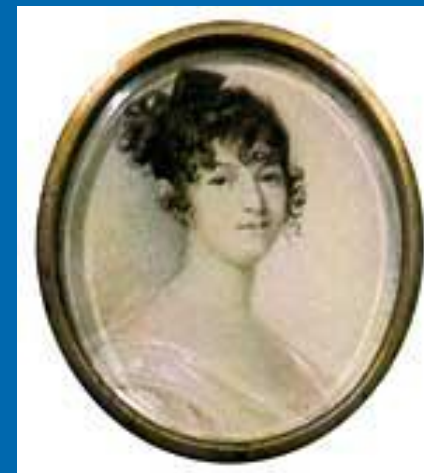
Мать, Надежда Осиповна Пушкина (1775-1836г.)