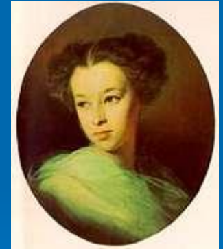
Младшая дочь, Наталья Александровна Пушкина (1836-1913г.) Получила