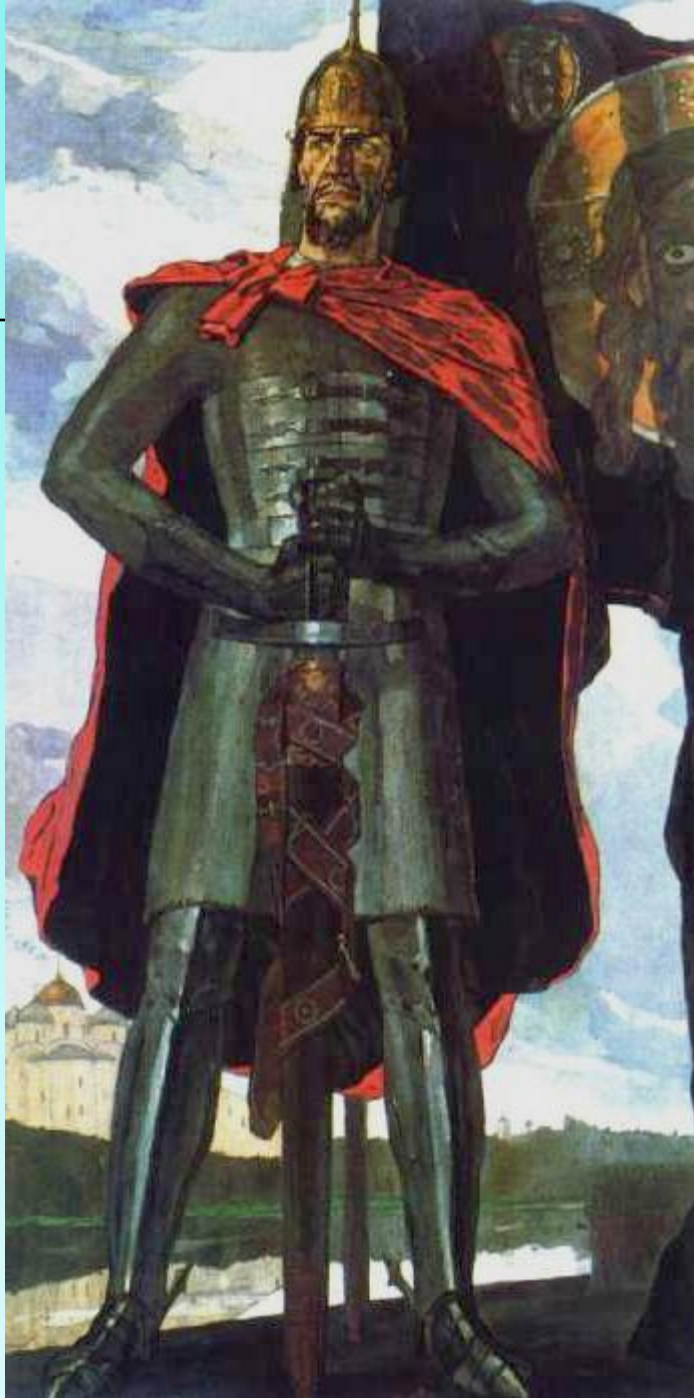
П. Д. Корин «Александр Невский»