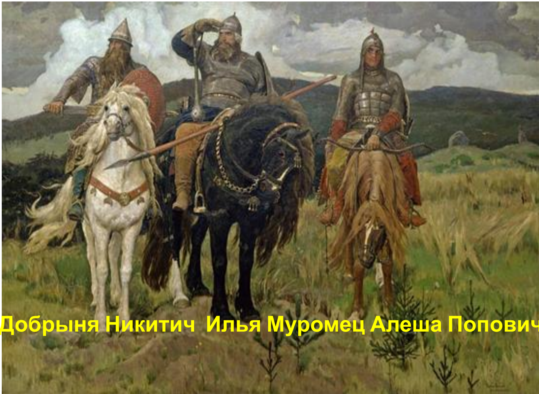
Добрыня Никитич Илья Муромец Алеша Попович