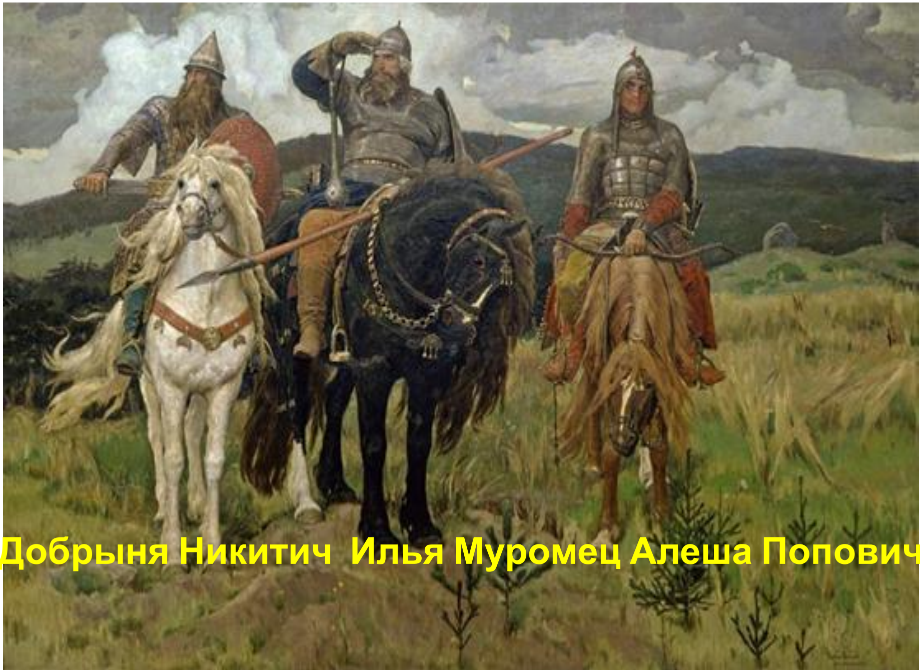
Добрыня Никитич Илья Муромец Алеша Попович