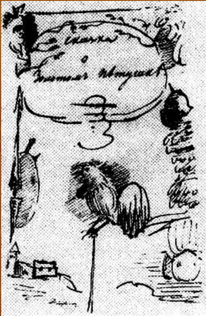
Обложка тетради с рукописью «Сказка о золотом петушке», 1834.Болдино

Последний раз поэт приезжал в Болдино осенью 1834 г. по запутанным делам именина и прожил там месяц. Но в этот раз он был настолько утомлен и истерзан душевно, что в середине октября вернулся в Петербург, написав лишь "Сказку о золотом петушке".