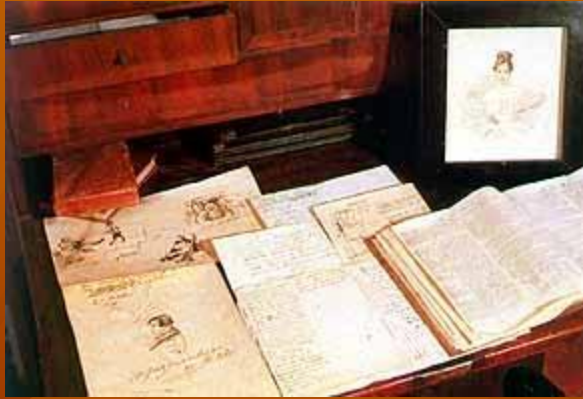
Бюро с портретом Н.Н. Пушкиной в кабинете поэта

Первый раз Пушкин приехал в Болдино в сентябре 1830 г. и предполагал пробыть там не более месяца, но был задержан холерным карантинном и прожил почти всю осень. За эти три месяца поэт написал более 40 произведений. Среди них: "Повести Белкина", "Маленькие трагедии", последние главы романа "Евгений Онегин", сказки, стихи, множество критических статей и набросков.