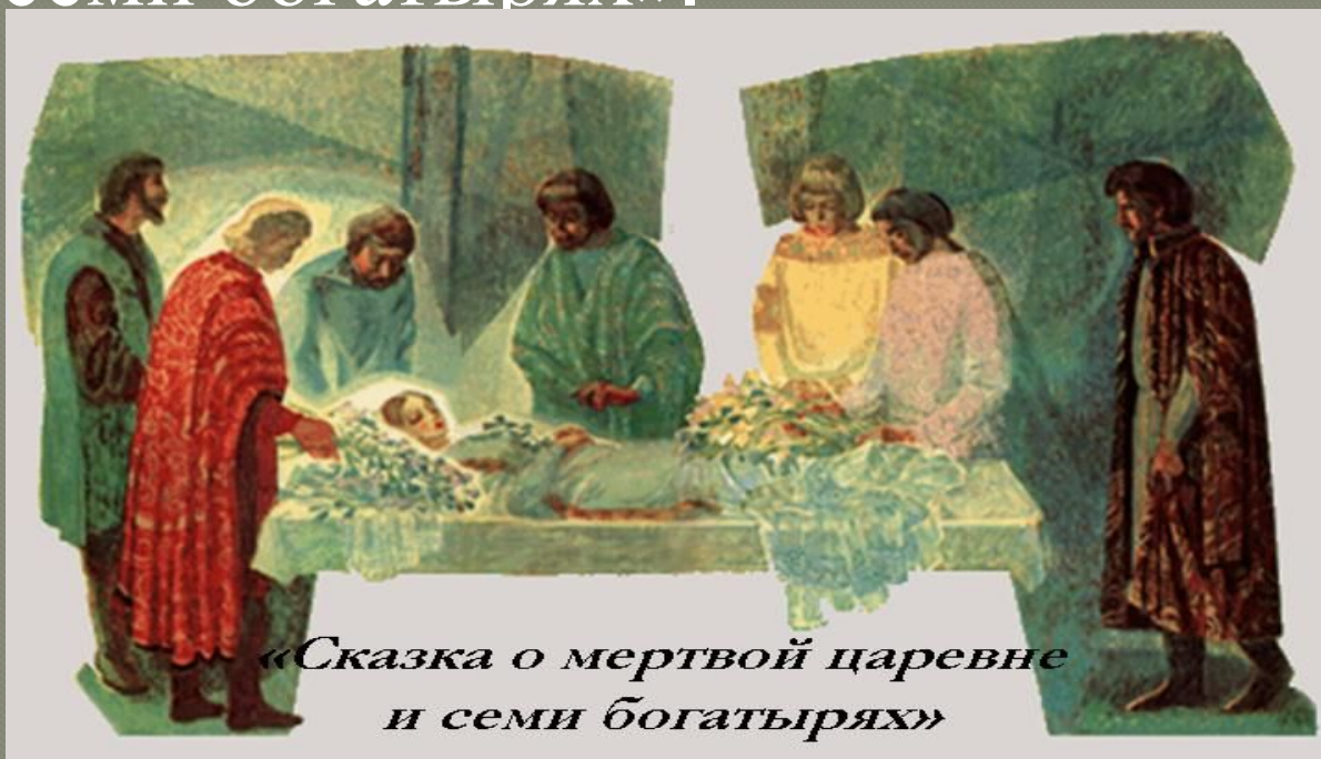
«Сказка о мертвой царевне и семи богатырях»