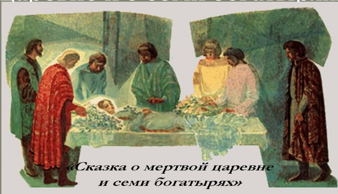
«Сказка о мертвой царевне и семи богатырях»