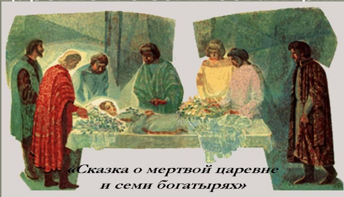
«Сказка о мертвой царевне и семи богатырях»