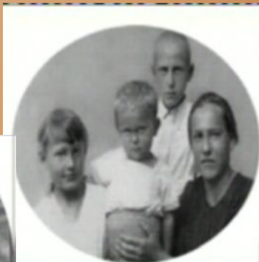
Отец Юры ушел на фронт и в 1944 г. погиб в Крыму, при штурме Сапун-горы.