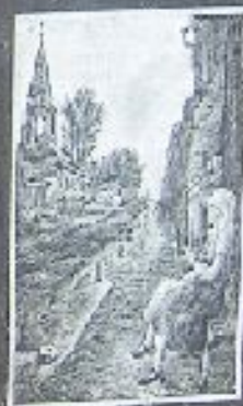
Снимок с Оки, в Коломне, 1946 г.