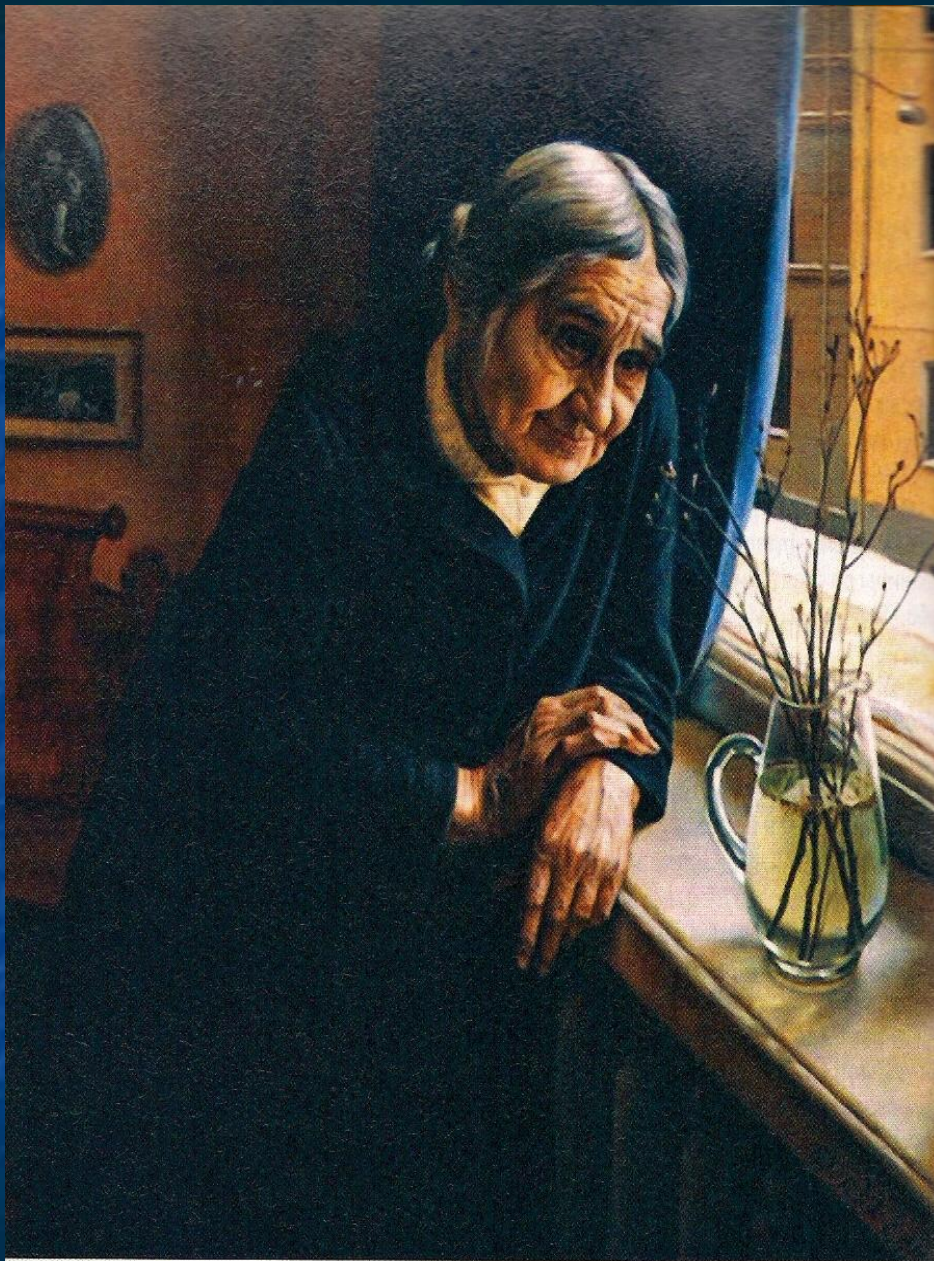
А.Шилов. Зацвел багульник. 1980