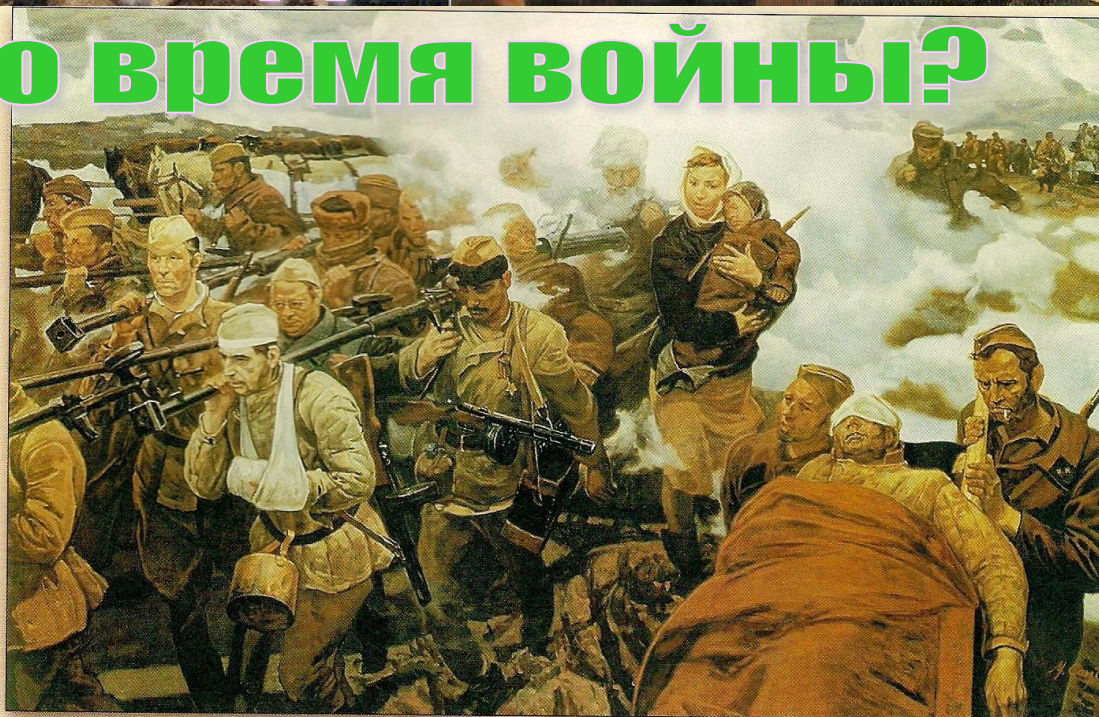
М.И.Самсонов. В боях за Отчизну. 1987