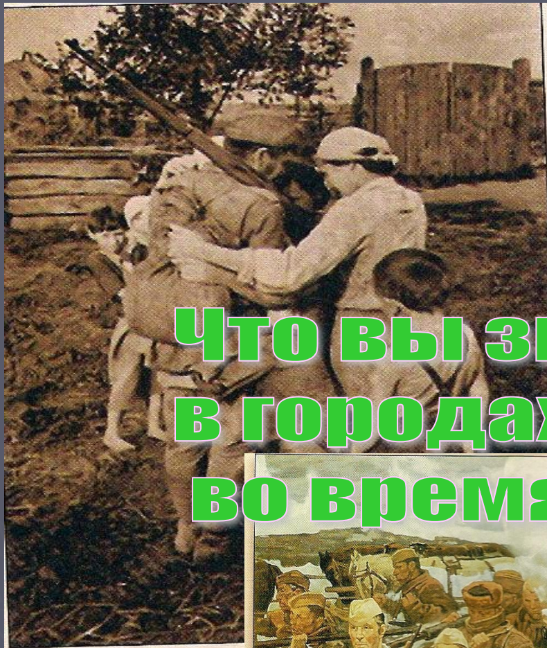
22 июня 1941 г.