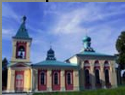
храм Преображения Господня.