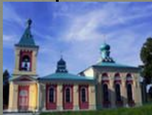
храм Преображения Господня.