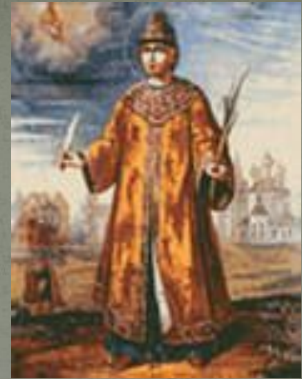
Дмитрий, сын Ивана Грозного

После Ивана Грозного остался ещё один сын, маленький царевич Дмитрий. Который вместе с матерью был отправлен в город Углич на Волге. Здесь в 1591 г. произошли страшные события, тайна которых не разгадана до сих пор. 8-летний царевич, страдавший от припадков эпилепсии (или, как тогда говорили, «падучей»), играя с ребятами в ножички (?), неожиданно стал биться, кататься по земле и сам себя убил ножом. По крайней мере, так гласила официальная версия.