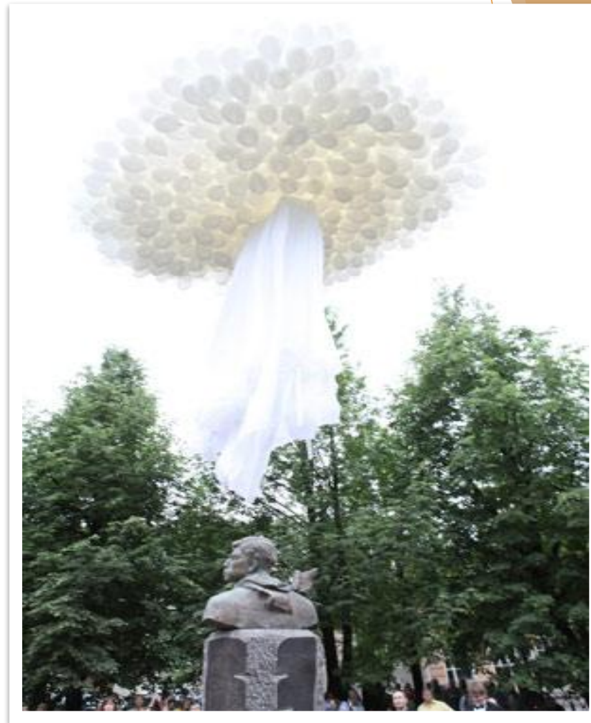
Памятники поэту Пастернаку