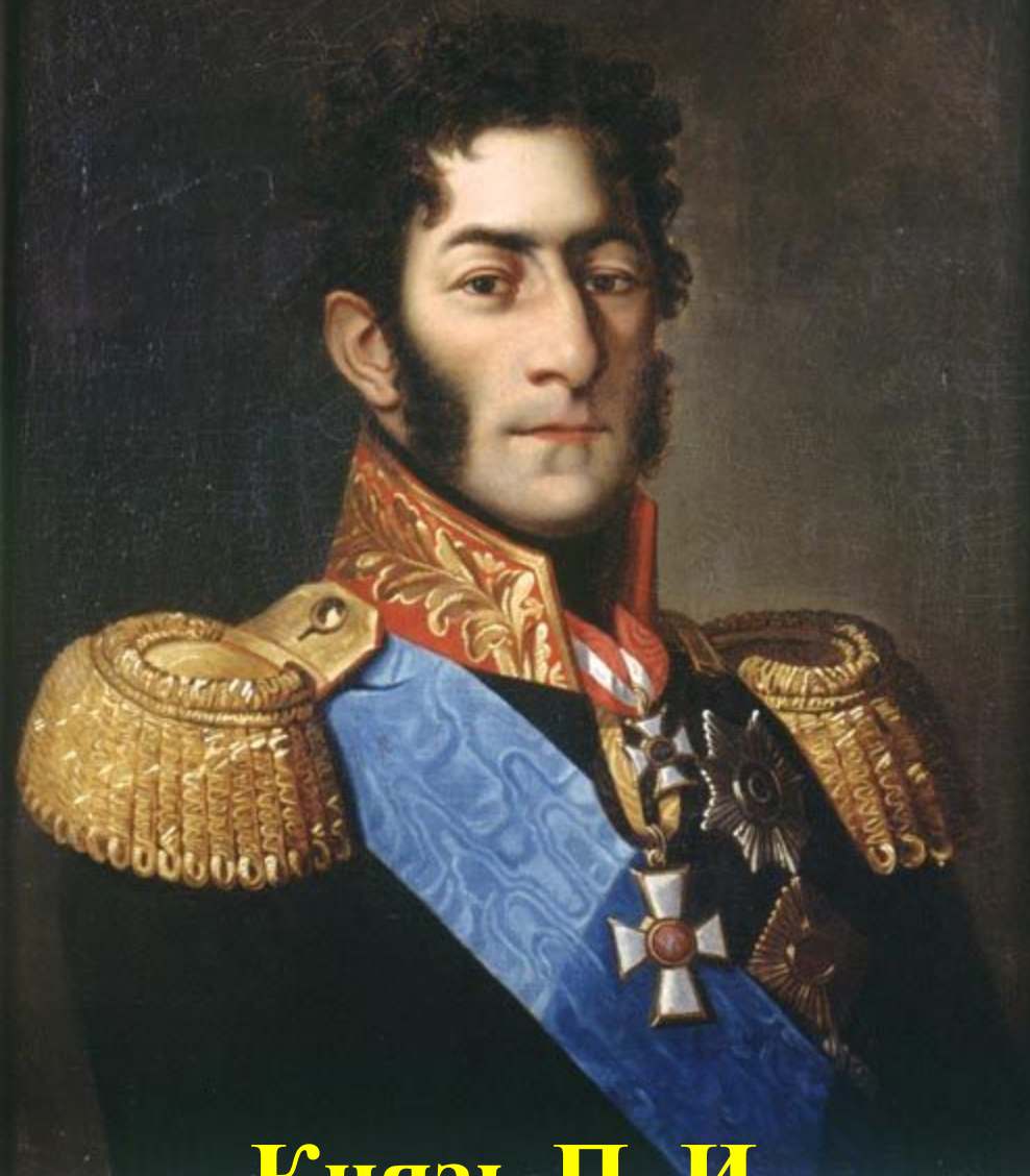
Князь П. И. Багратион.