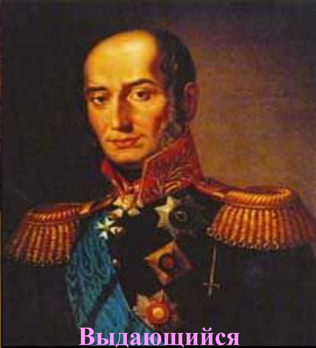
Выдающийся полководец России Барклай де Толли.