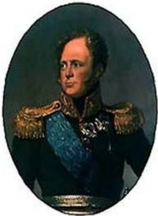
Александр I – российский император.