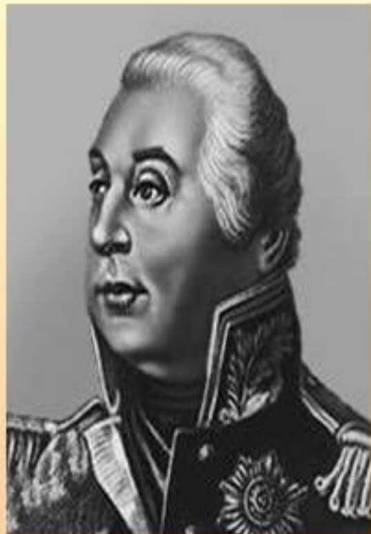
Кутузов Михаил Илларионович – русский полководец.