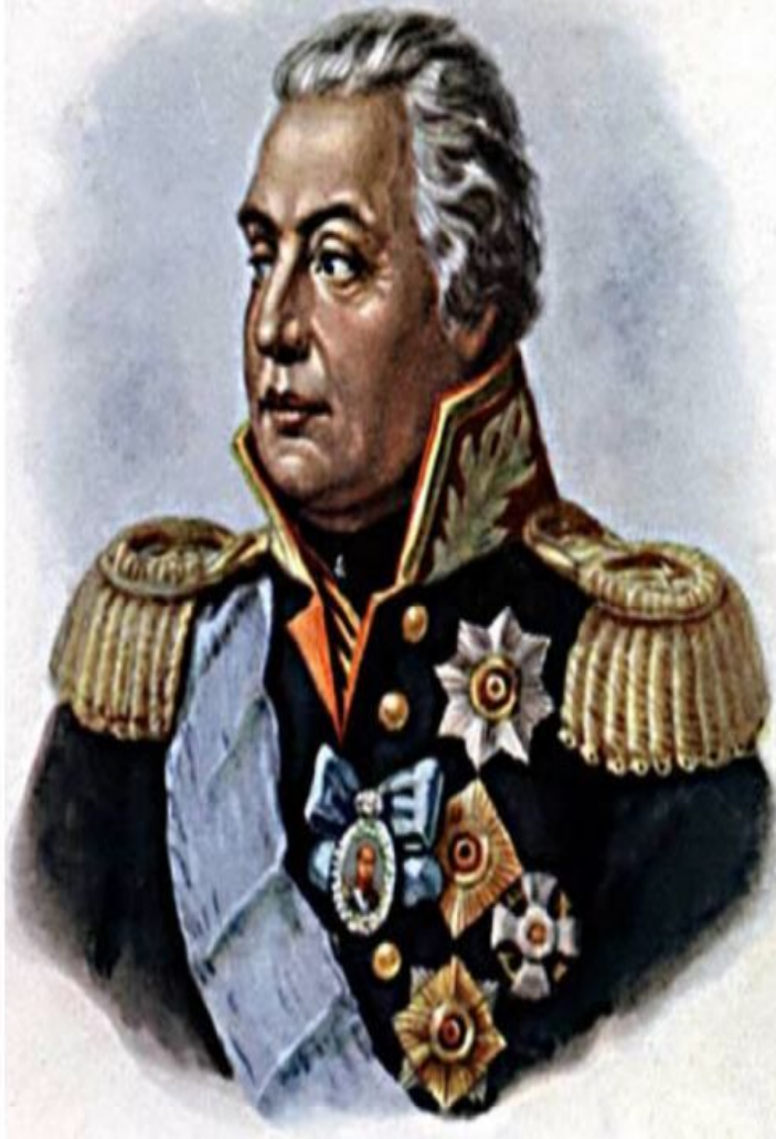
Михаил Илларионович Кутузов