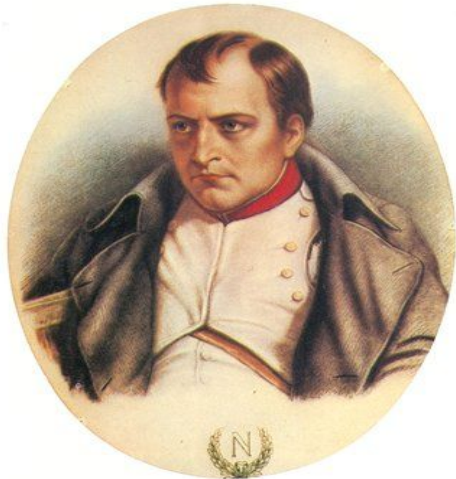
Наполеон I Бонапарт - французский полководец и государственный деятель.