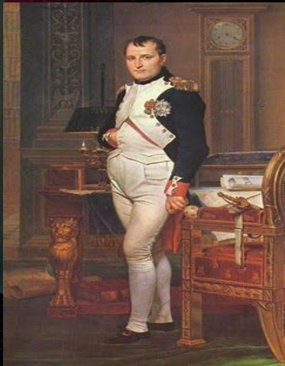
Князь П. И. Багратион.