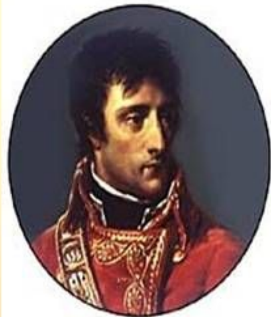
Наполеон Бонапарт – французский государственный деятедь, полководец.