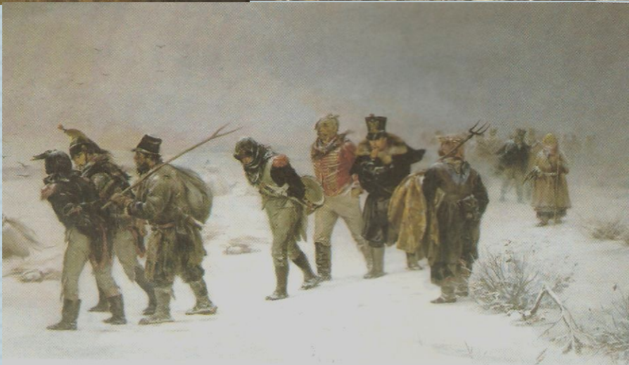
И. М. Прянишников. В 1812