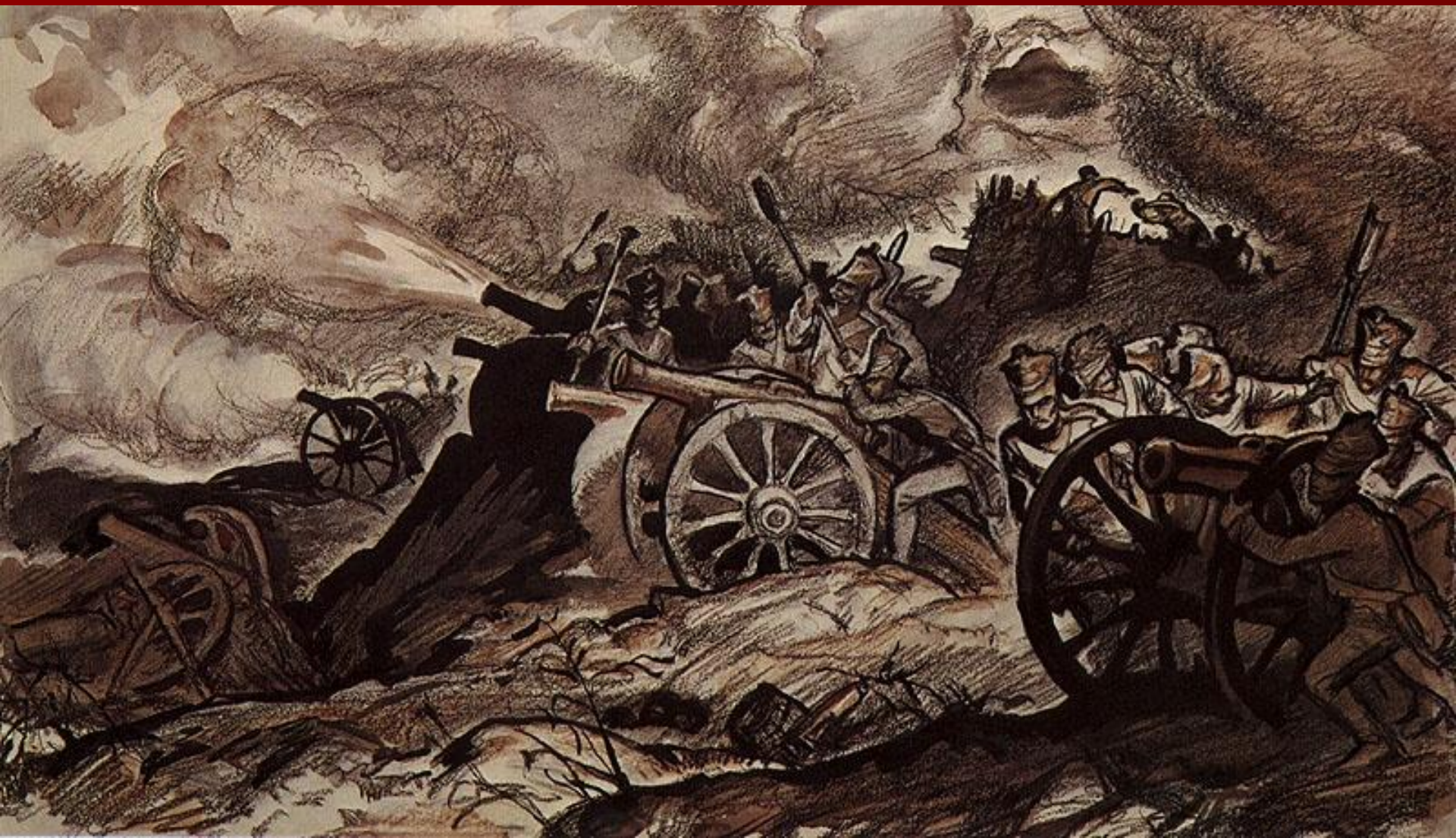
Батарея Раевского. Художник И. Архипов.