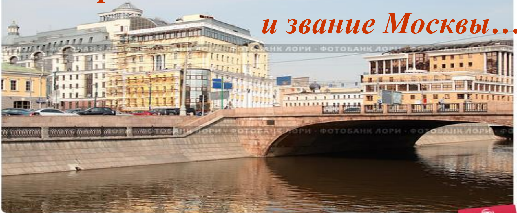
Большие дома на берегу реки Москвы