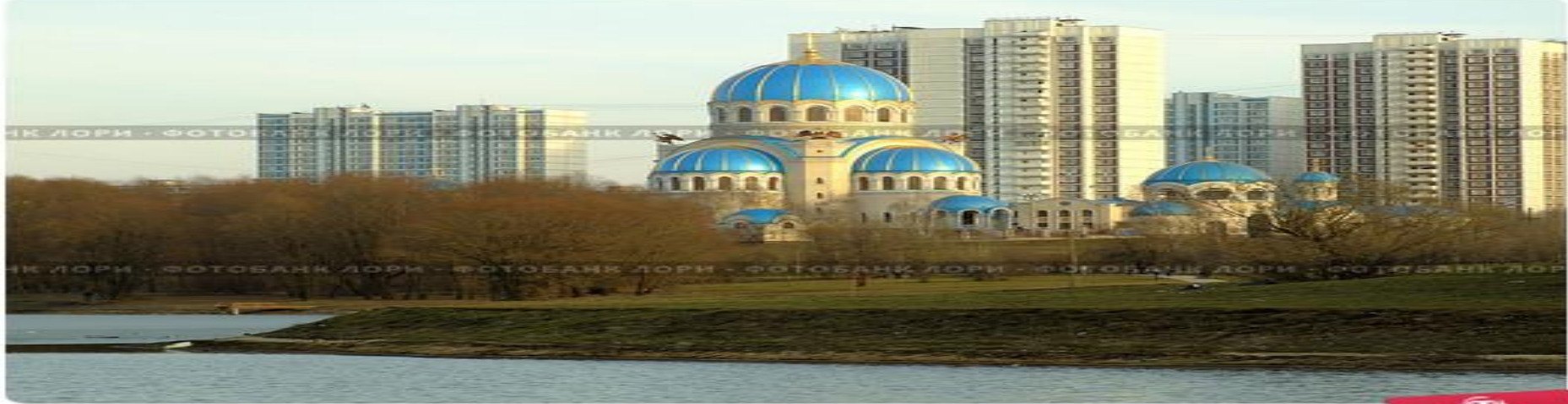
Храм Живоначальной Троицы на Борисовских прудах в г.Москве.