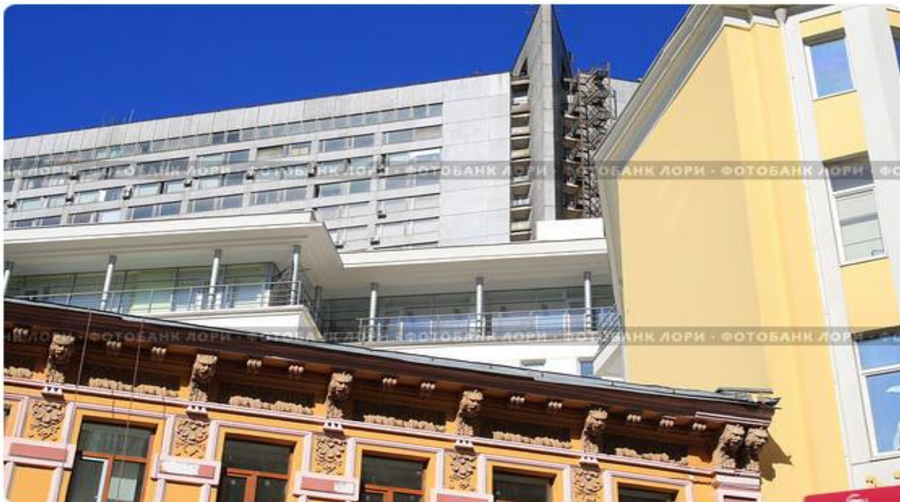
Дома старого Арбата. Смешение стилей и эпох

Первое место жительства – ул. Арбат, 43, коммунальная квартира на 4 этаже.