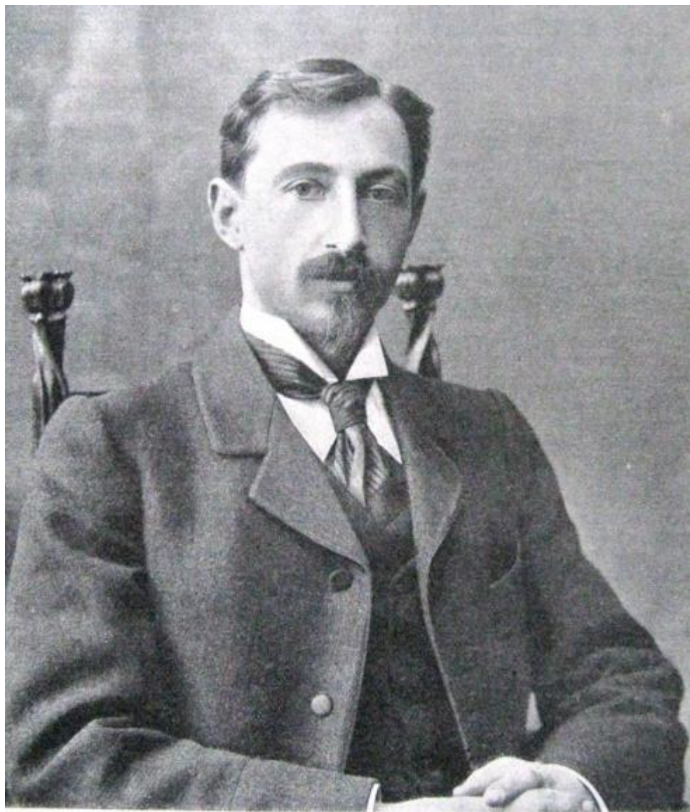
И. А. Бунинъ.