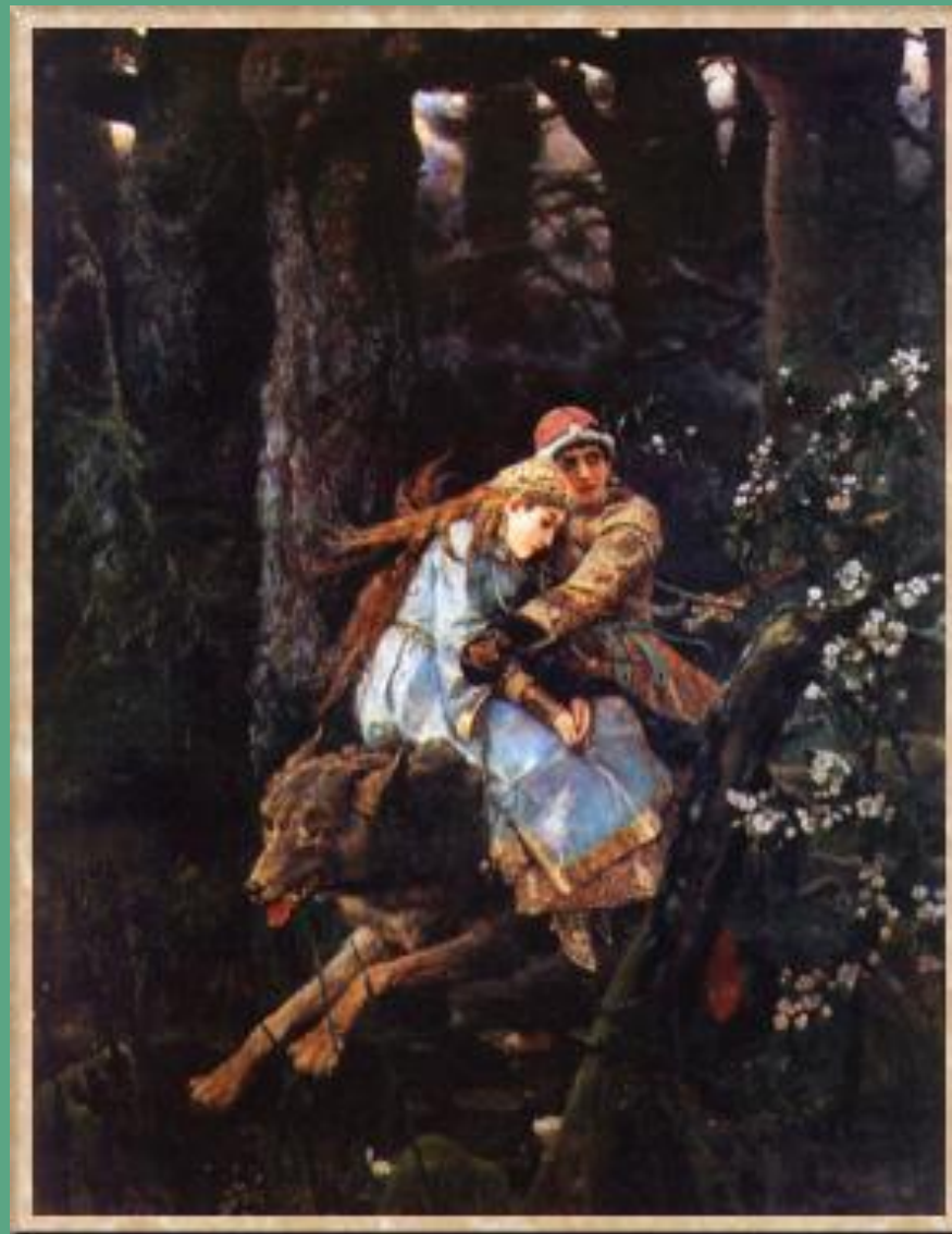
«Иван-царевич на Сером Волке».1889