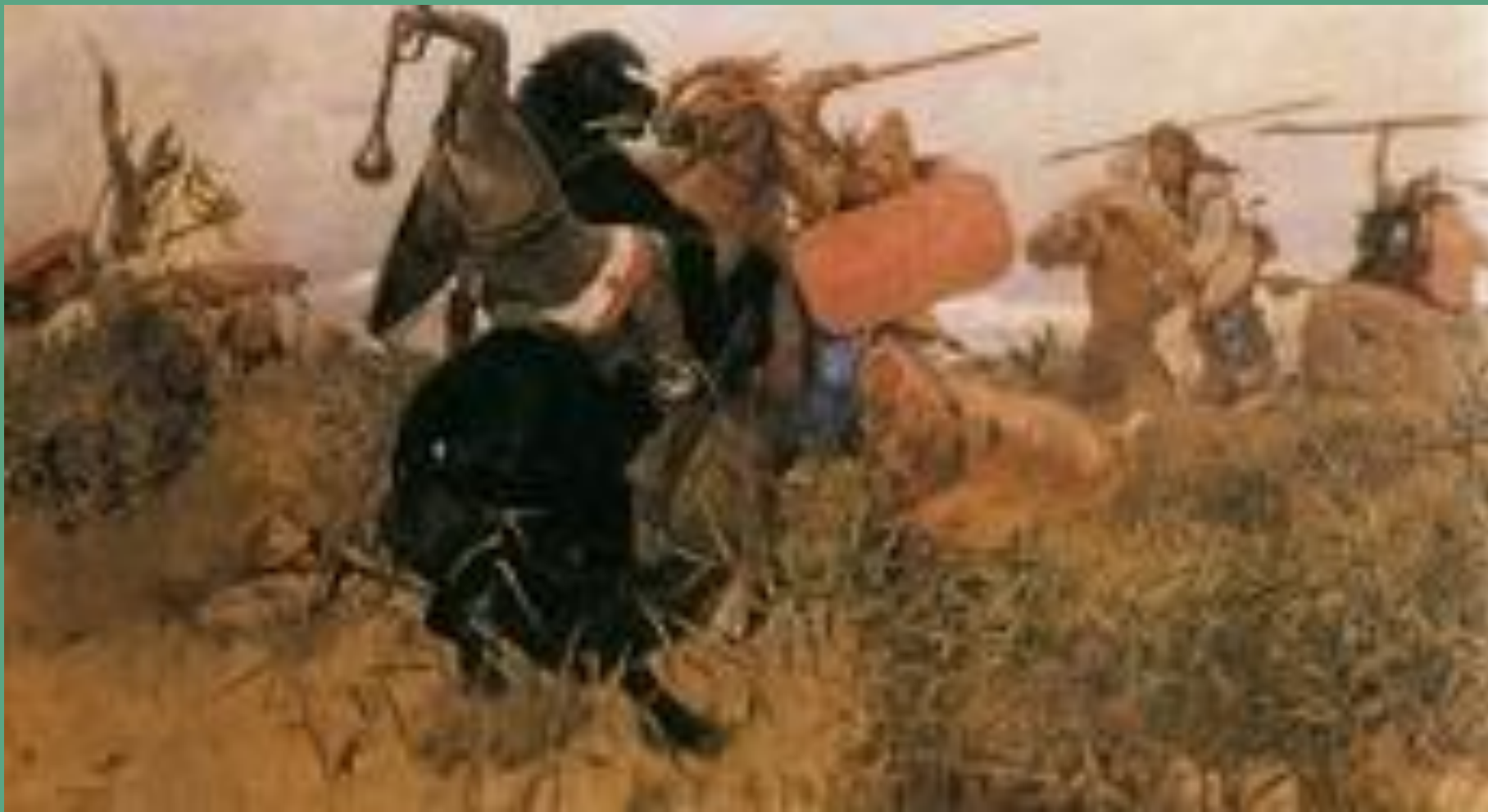
«Битва русских со скифами»