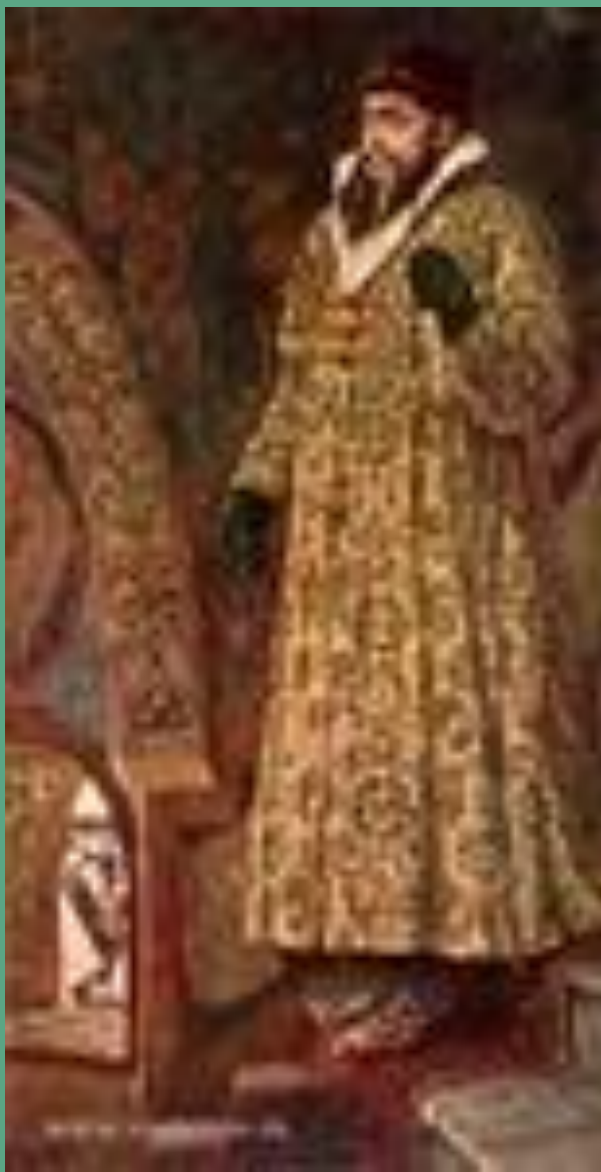
« Царь Иван Васильевич Грозный».1897