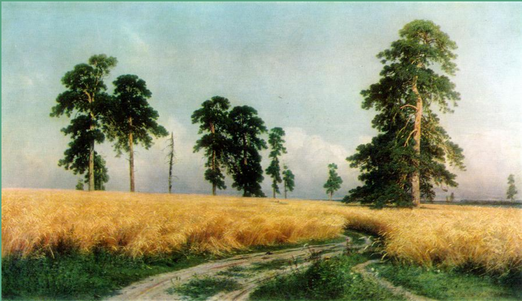
«Рожь». 1878. И. Шишкин