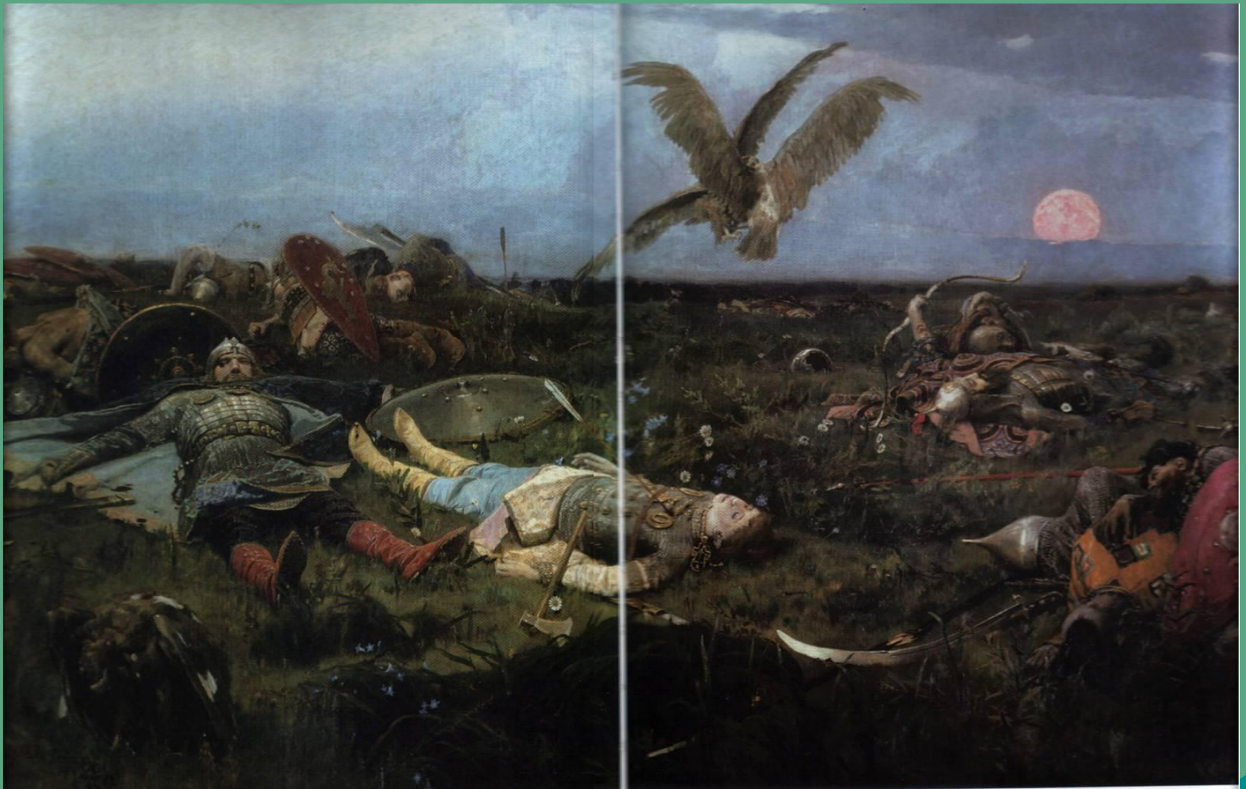
« После побоища Игоря Святославича с половцами».1880