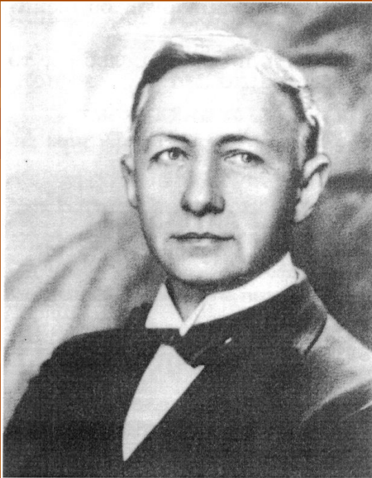
ИВАН АЛЕКСЕЕВИЧ БУНИН 1870 - 1953