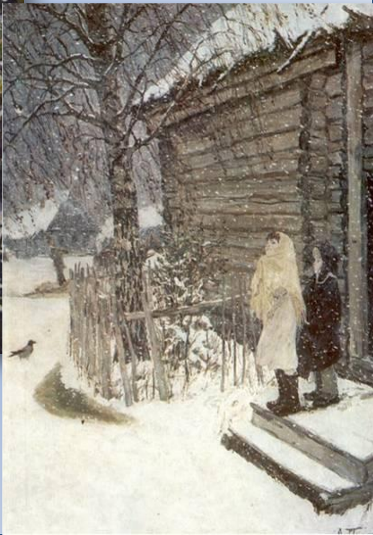
Пластов «Первый снег»