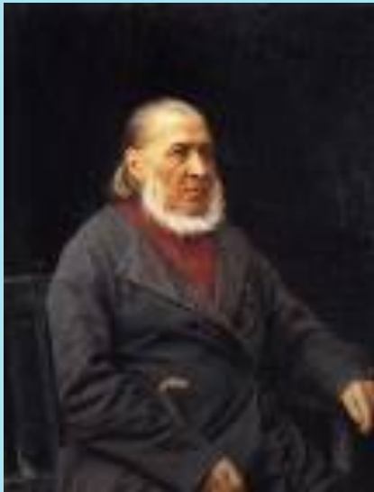
Портрет С.Т. Аксакова работы И. Крамского 1878 г.