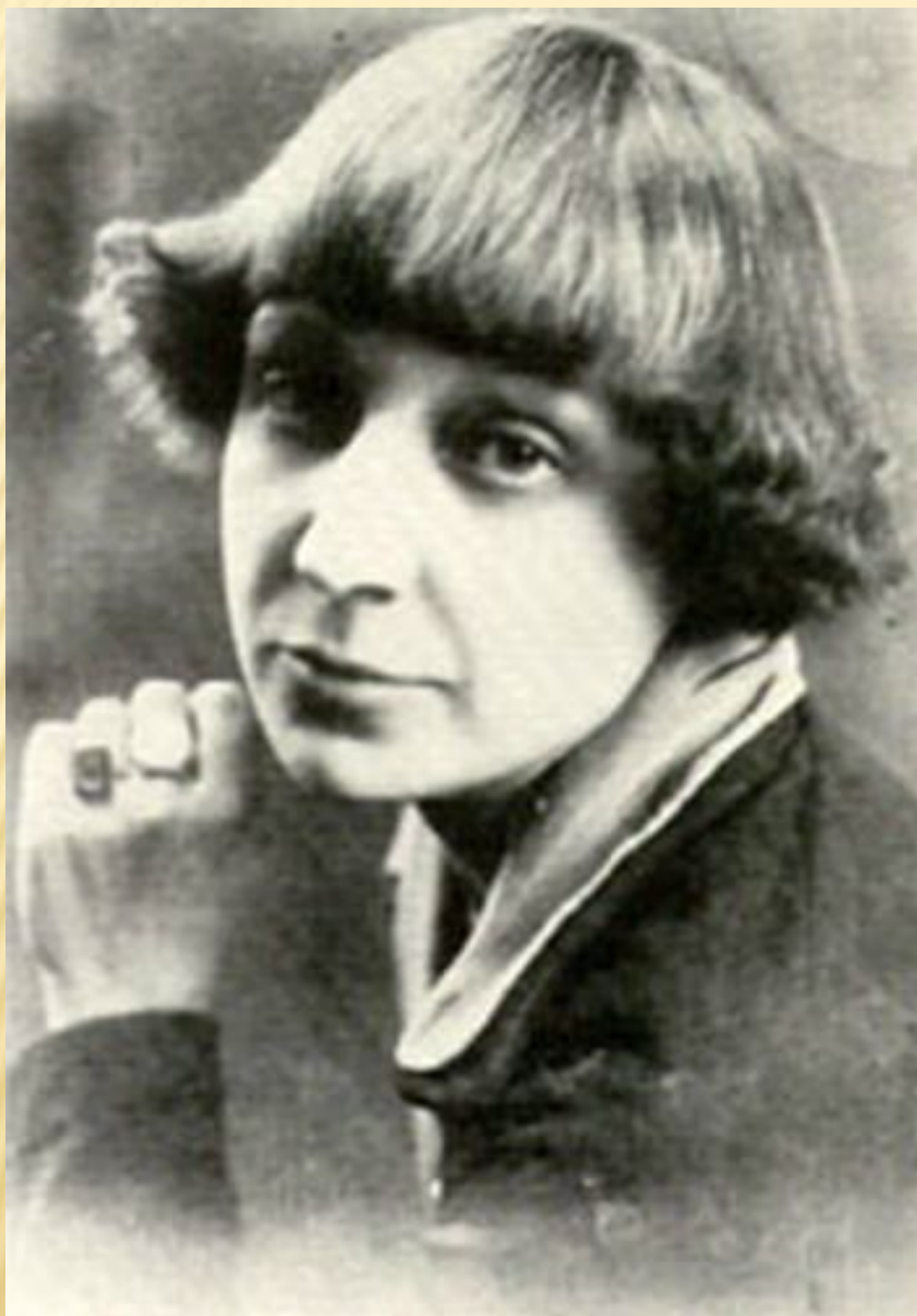
Марина Ивановна Цветаева (1892 – 1941)