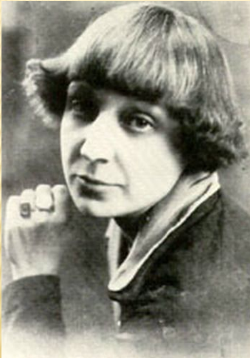
Марина Ивановна Цветаева (1892 – 1941)