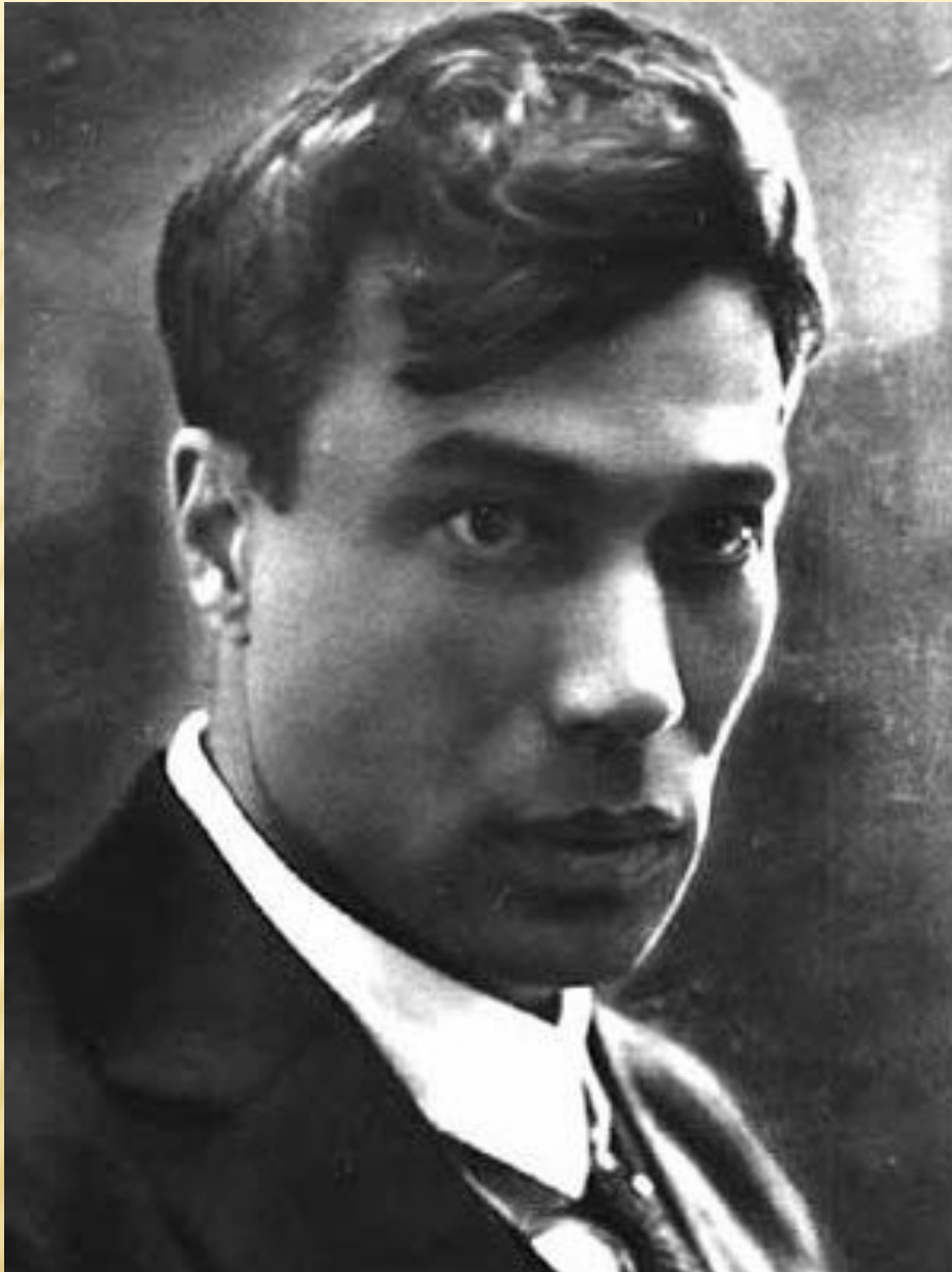
Пастернак Борис Леонидович (1890 – 1960)