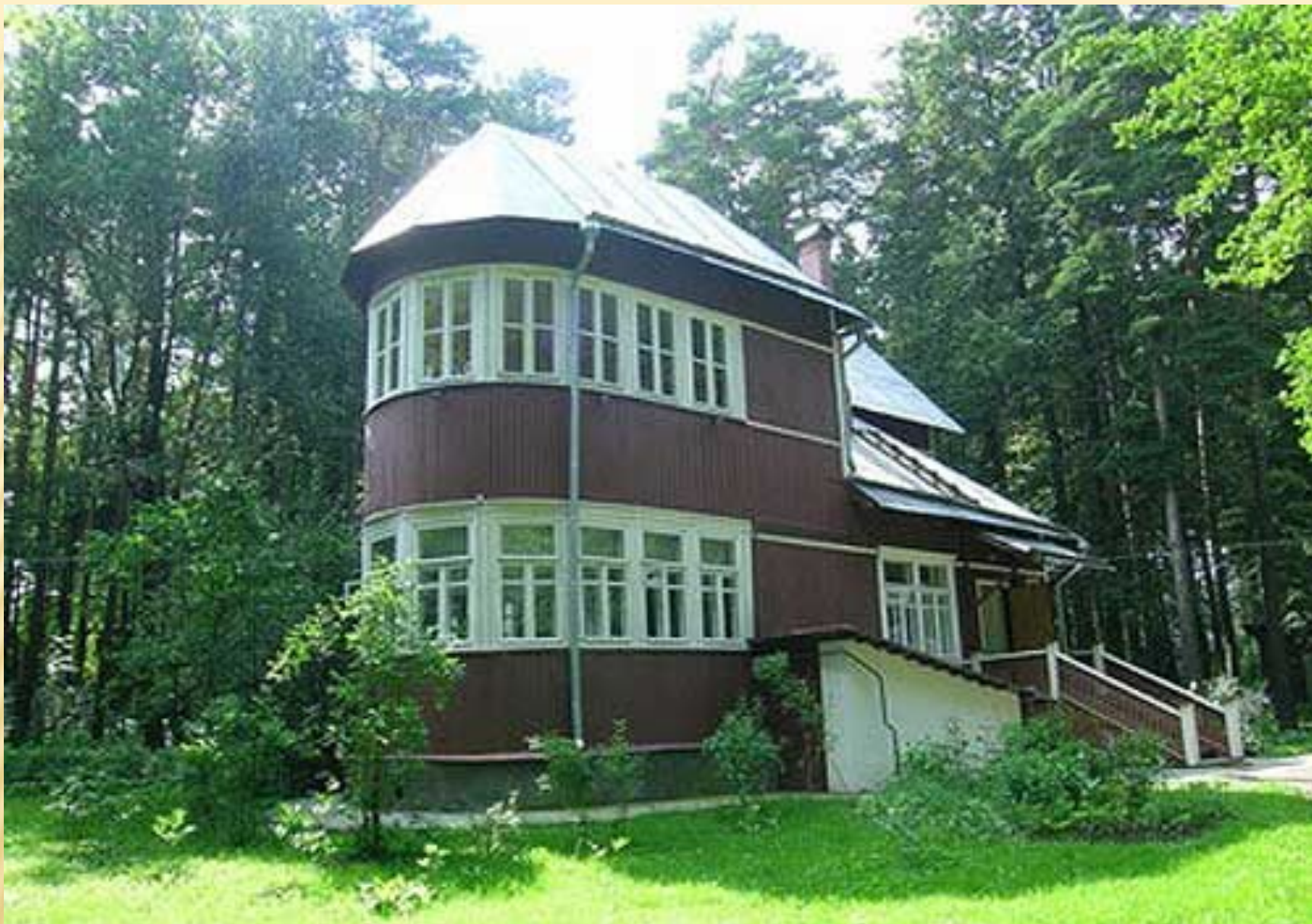
Дача Пастернака в д. Переделкино