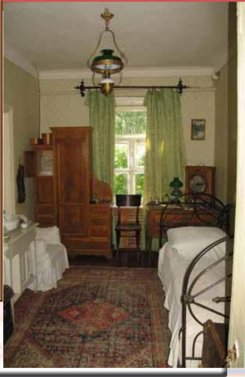
МУЗЕЙ ЧЕХОВА В МЕЛИХОВЕ