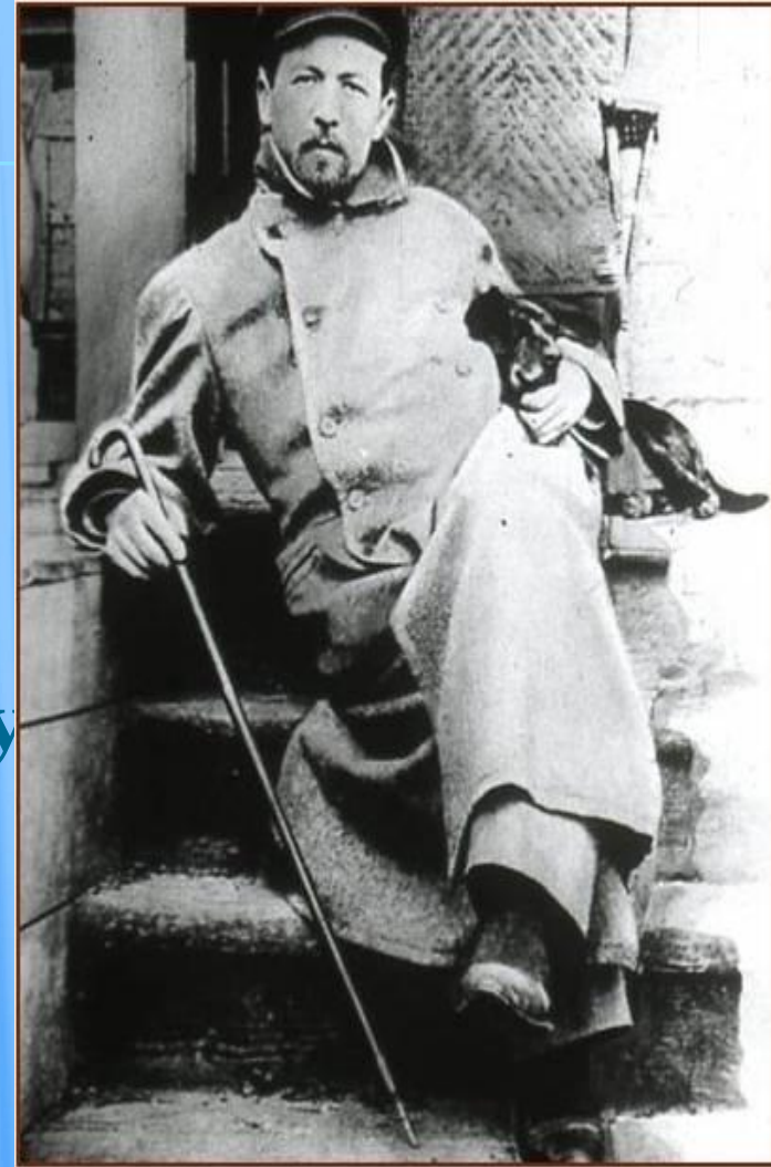
А.П. Чехов по возвращении из клиники

□ Весной 1897 года у Чехова началось резкое обострение туберкулезного процесса, давно беспокоящего его здоровье. В больнице Чехова посетил Л.Н. Толстой: «В клинике был у меня Лев Николаевич, с которым вели мы преинтересный разговор... Говорили о бессмертии». После чего Антон Павлович умирает.