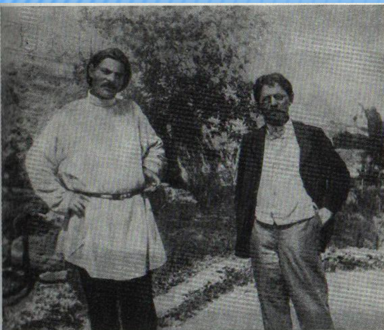
А. М. ГОРЬКИЙ и А. П. ЧЕХОВ Ялта, 1900 г.

Частым гостем Антона Павловича был М. Горький, считавший знакомство с Чеховым «самым ценным подарком судьбы».