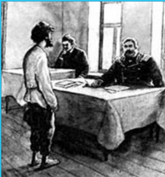
Иллюстрация к рассказу А.П. Чехова «Злоумышленник». Художник Н.А. Пономарев.

Чехов был очень веселым, неистощимым на выдумки человеком, но на самом деле веселого у него очень мало: общий тон — мрачный и безнадежный. Перед нами разворачивается ежедневная жизнь во всем трагизме своей мелочности, пустоты и бездушия («Анюта», «Хористка», «Злоумышленник», «Ванька»), полное отсутствие нравственного чувства и стремления к идеалу — вот та картина, которая разворачивается перед читателем рассказов Чехова.