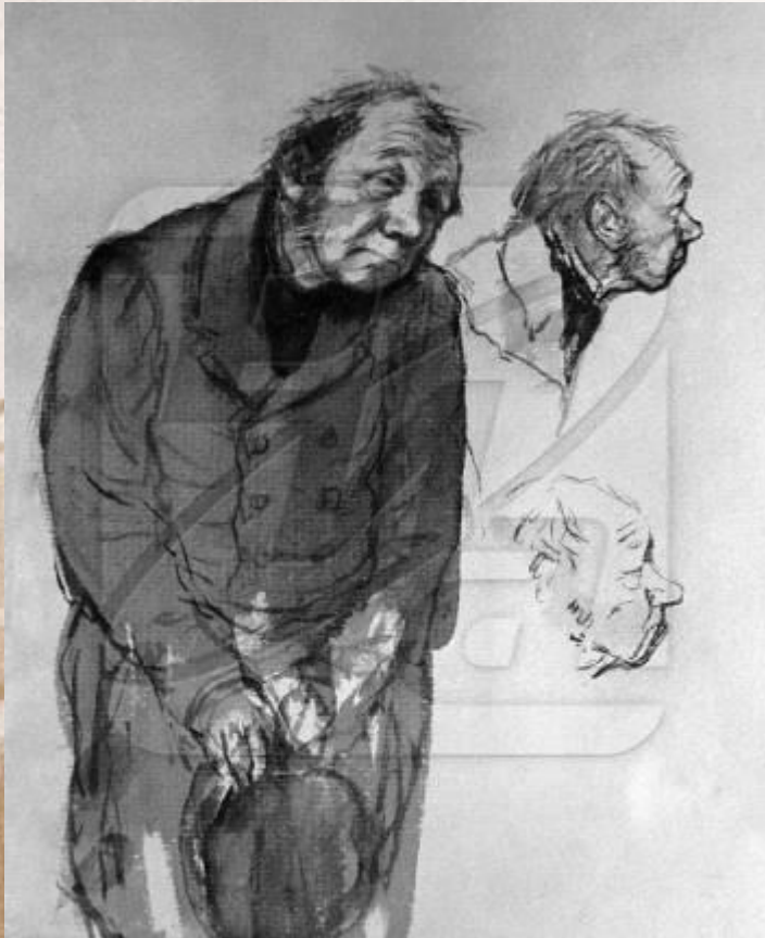
Репродукция иллюстрации художников Кукрыниксов к повести Н. В. Гоголя "Шинель". Портрет Башмачкина

Акакий Акакиевич Башмачкин. Из-за бедности не может жениться, только мечтает об этом. Его неспособность противостоять действительности, бедность вызывают сострадание, жалость, сочувствие, желание помочь. Смерть в конце повести тоже оправдана: простудился, заболел, умер.