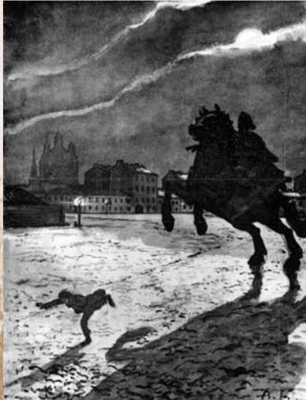
Фронтиспис к «Медному всаднику» А.С.Пушкина. 1903

Евгений. Была у него невеста, хотел жениться, мечтал о простом человеческом счастье, но наводнение разрушило все мечты. Герой обезумел. Смерть героя оправдана. Нам его жалко, мы ему сочувствуем.